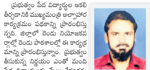
-నిరాశ్రీణ, డిఆఫ్, జోగులూరు గడ్డాల