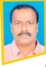
-నర్సింహాబు, డిఆర్డీవో, వనపర్తి