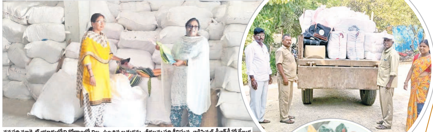
వనపర్తి మార్కెట్ యార్డులోని గోదాండ్లో నిల్వ ఉంచిన బతుకమ్మ చీరలను పంపిణీస్తున్న అడిషనల్ డిఆర్డీవో రేణుక