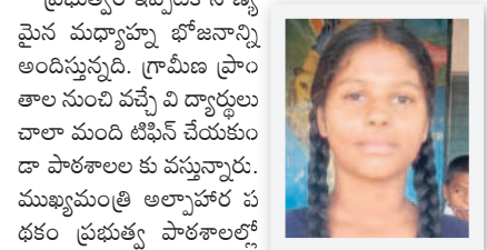
-ప్రభుత్వ విద్యార్థిని, ధరూర్ ఉన్నత పాఠశాల, గడ్డాల జిల్లా