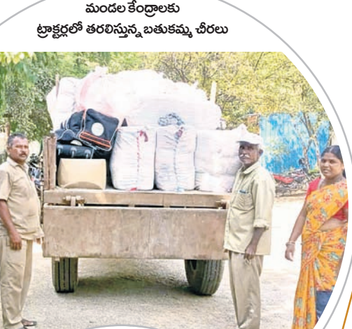
మండల కేంద్రాలకు ట్రాక్టర్లలో తరలిస్తూ, బతుకమ్మ చీరలు