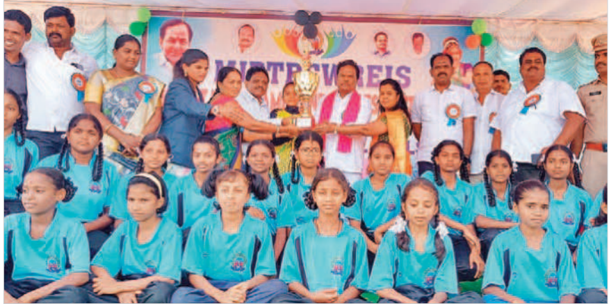
విజేతలకు బహుమతులు అందజేస్తున్న ఎమ్మెల్యే జైపాల్ యాదవ్

కల్వకుర్తి, అక్టోబర్ 5 : రాష్ట్ర ప్రభుత్వం క్రీడలకు పెద్ద పీట వేస్తూ క్రీడాకారులను ప్రోత్సహిస్తున్నదని కల్వకుర్తి ఎమ్మెల్యే జైపాల్ యాదవ్ అన్నారు. కల్వకుర్తి పట్టణంలోని జ్యోతిరావు పుల్ వెనకబడిన తరగతులు గురుకుల పాఠశాలలో నాలుగు రోజులపాటు నిర్వహించిన ఉమ్మడి పాలమూరు జిల్లా స్థాయి అండర్-14, అండర్-19 బీసీ గురుకుల విద్యార్థుల క్రీడాోత్సవాలు గురువారం ముగిశాయి. ముగింపు ఉత్సవాలకు ఎమ్మెల్యే ముఖ్య అతిథిగా హాజరై విజేతలకు ప్రీత్సాహాలు బహుమతులు అందజేశారు. ఈ సందర్భంగా ఏర్పాటు చేసిన కార్యక్రమంలో ఆయన మాట్లాడుతూ.. విద్యోతోపాటు క్రీడలకు పెద్దపీట వేయాలనే లక్ష్యంతో సీఎం కేసీఆర్ నిధులు కేటాయిస్తున్నారన్నారు. గెలుపు, ఓటములను సమానంగా తీసుకొని మరింతగా రాజీంచాలని సూచించారు. పేద విద్యార్థులకు కాన్సర్వేట్ స్థాయిలో విద్యను అందించాలనే లక్ష్యంతో సీఎం కేసీఆర్ ఎక్కువ మొత్తంలో గురుకుల పాఠశాలలు, కళాశాలలు ఏర్పాటు చేసి నాణ్యమైన భోజనం, మెరుగైన విద్యను అందిస్తున్నారన్నారు. ప్రభుత్వం ఇస్తున్న అవకాశాలను సద్వినియోగం చేసుకుని ఉన్నత శిఖరాలను అధిరోహించాలని విద్యార్థులకు పిలుపునిచ్చారు. కార్యక్రమంలో మున్సిపల్ చైర్మన్ ఎన్టీ సత్యం, ఎంపీపీ మనోహర, మార్కెట్