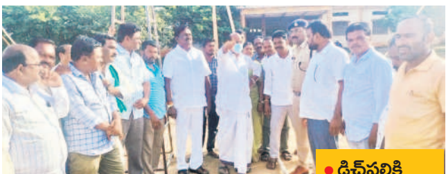
డిచ్ పల్లిలో ఏర్పాట్లను పరిశీలిస్తున్న ఎమ్మెల్యే బాజరెడ్డి

-ఎల్లారెడ్డి/మద్నూర్/నిరికొండ/పల్నాటి అక్టోబర్ 5