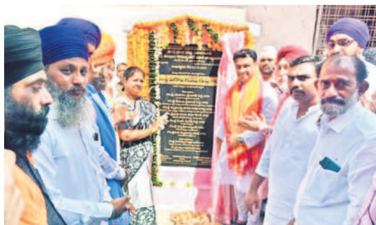
వివరాలు IV లో