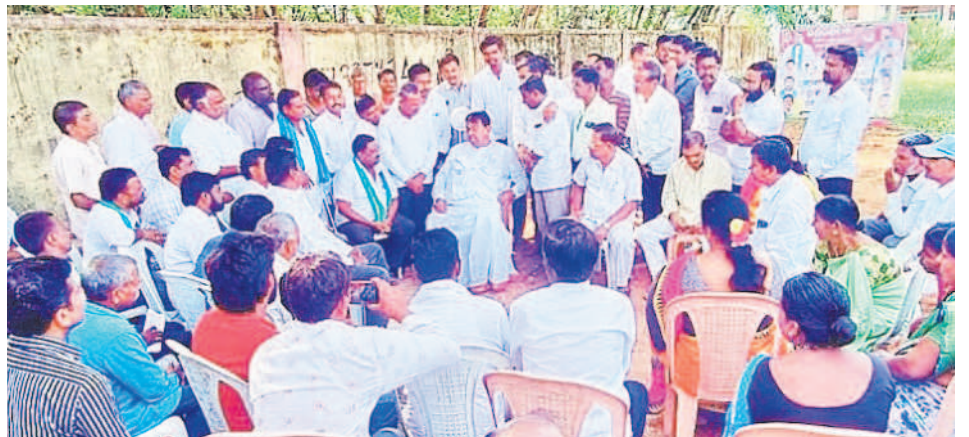
మున్నూరు కాపు కుల సంఘ సభ్యులతో మాట్లాడుతున్న స్వీకర్ పోచారం

'మంత్రి పదవులు చాలాసార్లు చేశా. అత్యున్నత స్థానమైన, రాజ్యాంగబద్ధ పదవి స్వీకర్ గా ఉన్నా. ఇంతకు మించిన పదవులు నాకొద్దు. ఇప్పటిదాకా చాలామంది స్వీకర్ గా పదవులు చేసిన వారు తర్వాతి ఎన్నికల్లో ఓడిపోయిండ్రు. చరిత్ర చెబుతున్నది అదే. కానీ మీరు చరిత్రను తిరగరాయాలే. నేను మీతో మమేకమయ్యా. ఏ అవసరమున్నా తీర్చిన. మీరు ఆశీర్వదించి నన్ను గెలిపించి కొత్త చరిత్రను లిఖించాలి.'