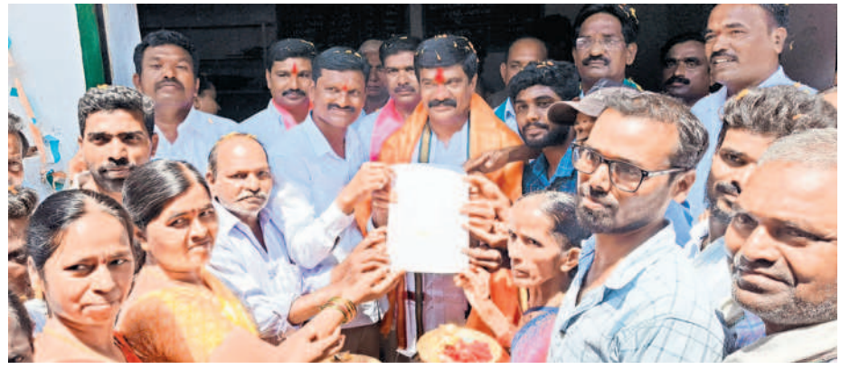
మానాలలో మంత్రివేములకు మద్దతు ప్రకటిస్తూ తీర్మాన పత్రాన్ని అందజేస్తున్న ముదిరాజు కలస్టులు