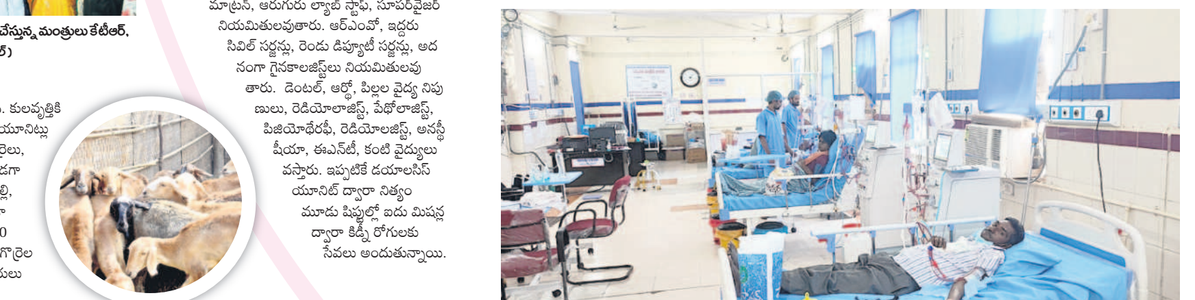
కిక్కి రోగులకు సేవలందిస్తున్న డయాలసిస్ సెంటర్

వంద పడకలతో ప్రారంభమైన కోరుట్ల వైద్యశాల, 30 ఏండ్లలోనే వంద పడకలుగా రూపాంతరం చెందడం పట్టణాసుల భాగ్యంగా చెప్పుకోవచ్చు. జగిత్యాల జిల్లాలోనే రెండో పెద్ద దవాఖానగా నిలుస్తున్నది. ప్రస్తుతం జిల్లా జిల్లా ప్రధాన దవాఖాన 300 పడకలకు ఆపివేటి అయింది. మెట్వల్ల సీహెచ్సీ 50 పడకలతో సేవలందిస్తున్నది. అయితే 30 పడకలతో ఉన్న కోరుట్ల సీహెచ్సీ 100 పడకలకు ఆపివేటి చేయడం, నూతన దవాఖాన నిర్మించి ప్రారంభించుకోవడం తుండడంతో జిల్లాలోనే రెండో పెద్దానుపత్రిగా ప్రత్యేకతను సంతరించుకోనున్నది.