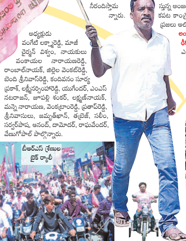
బీఆర్ఎస్ శ్రేణుల బైక్ రాల్లి