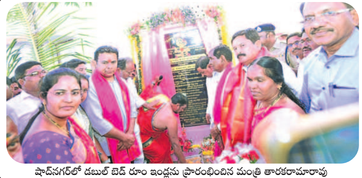
షాద్ నగర్లో డబుల్ బెడ్ రూం ఇండ్లను ప్రారంభించిన మంత్రి తారకరామారావు