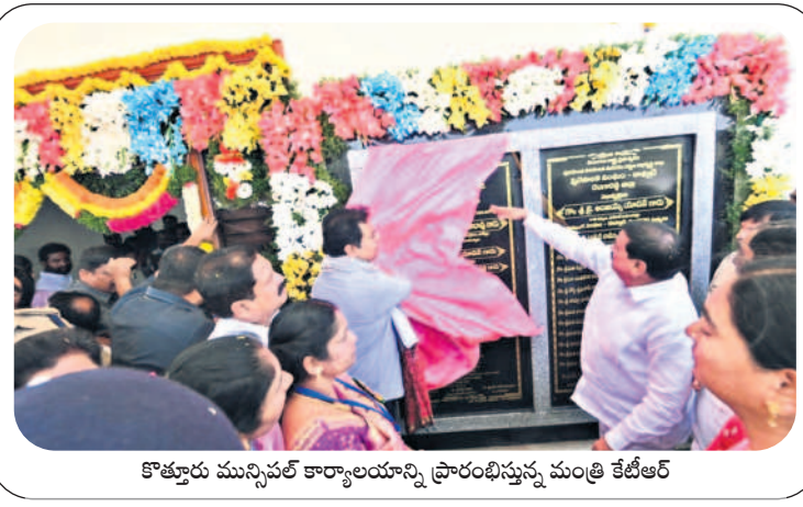
కొత్తూరు మున్సిపల్ కార్యాలయాన్ని ప్రారంభిస్తున్న మంత్రి కేటీఆర్