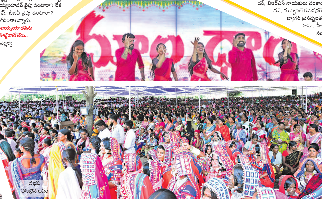
సభకు హాజరైన జనం