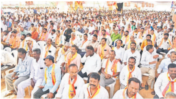
ముదిరాజ్ ఏసీ ఫంక్షన్ హాల్ ప్రారంభ కార్యక్రమానికి హాజరైన ముదిరాజ్ కులస్తులు