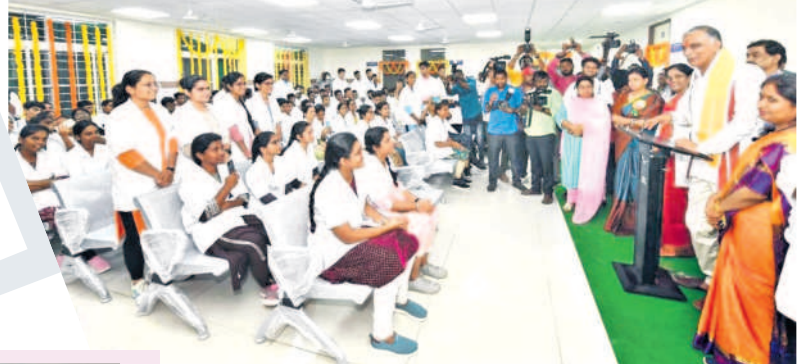
వైద్య విద్యార్థులతో మాట్లాడుతున్న మంత్రి హరీశ్ రావు