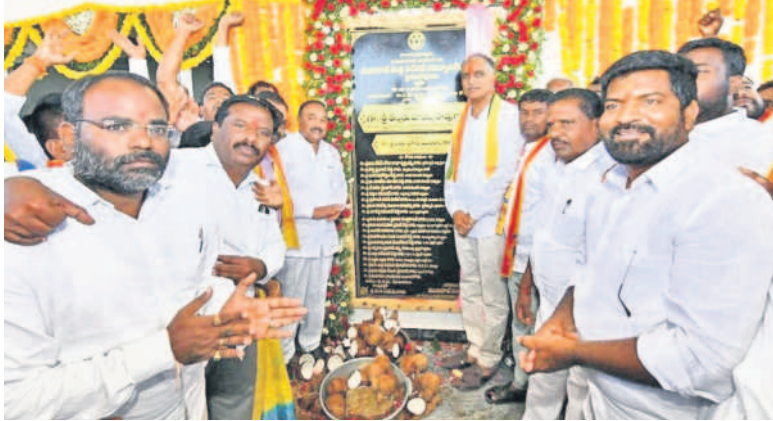
సిద్దిపేటలో ముదిరాజ్ ఏసీ ఫంక్షన్ హాల్ను ప్రారంభిస్తున్న మంత్రి తన్నీరు హరీశ్ రావు