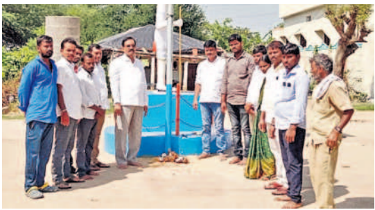
పీటీవెంకటాపూర్ లో హైమాస్ట్ లైట్లను ప్రారంభిస్తున్న జడ్పీటీసీ