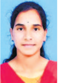
-పిట్లపర్తి సౌజన్య, చిలుకూరు

నేను డిగ్రీ పూర్తి చేసి పోలీస్ ఉద్యోగాలకు నోటిఫికేషన్ వసి వెలువడగానే హైదరాబాద్ లో కోచింగ్ తీసుకుంటూ ప్రైవేట్ అయ్యాను. దేవాదూరం పరీక్షలకు సాధించి మేనే కుమార్ టో పోలీస్ ఉద్యోగం సాధించాను. మొదటి ప్రయత్నంలోనే ఎంపిక ఉద్యోగం సాధించాను. తల్లిదండ్రుల ప్రోత్సాహం ఉద్యోగ సాధనకు ఎంతో సహాయం చేసింది. అంతాకూడా ఎలాంటి పైరవీలు, అంచాలకు తావులేకుండా పోలీస్ రిక్రూట్ మెంట్ పూర్తిచేసిన ప్రభుత్వానికి కృతజ్ఞతలు.