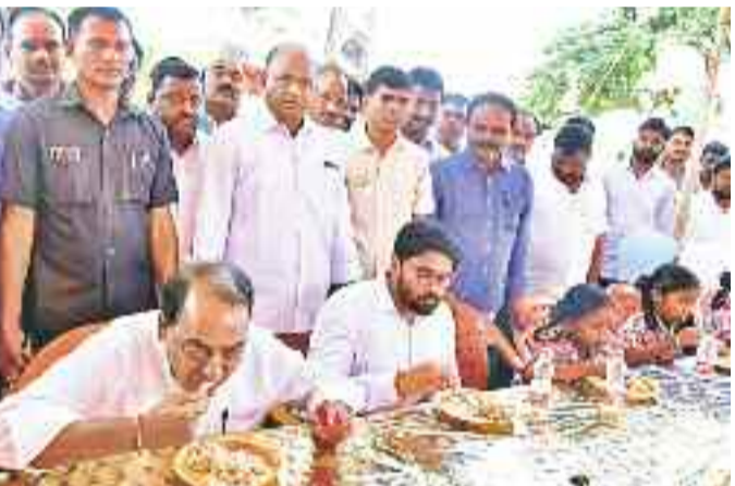
నిర్మల్ జిల్లా సోన్ లోని ప్రాథమిక పాఠశాలలో అల్పహారం పథకాన్ని ప్రారంభించి దుబిమాస్తున్న మంత్రి ఇంద్రకణ్ణి రెడ్డి, కలెక్టర్ పరుణ్ రెడ్డి