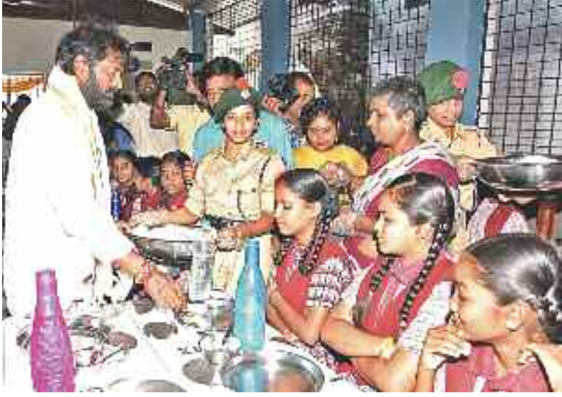
మహబూబ్ నగర్ లోని మోడల్ బేసిక్ ఉన్నత పాఠశాలలో విద్యార్థులకు అల్పహారం వడ్డిస్తున్న మంత్రి శ్రీనివాస్ గౌడ్