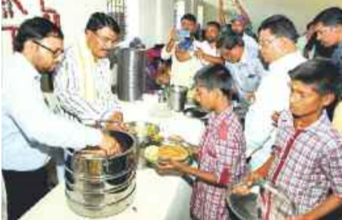
వనపర్తిలోని 18వ వార్డు ఉన్నత పాఠశాలలో విద్యార్థులకు అల్పహారం వడ్డిస్తున్న మంత్రి నిరంజన్ రెడ్డి

దేశంలో మధ్యాహ్నం భోజన పథకాన్ని 1 నుంచి 8 వ తరగతుల వరకే అమలు చేస్తుండగా.. రాష్ట్రంలో 9, 10 తరగతులకు కూడా విస్తరించి సీఎం కేసీఆర్ మానవ యతను చాటారు. దీనికోసం ప్రభుత్వం అదనంగా రూ.137 కోట్లు ఖర్చు చేస్తున్నది. దొడ్డు బియ్యానికి బదులు సన్నబియ్యం, వారానికి మూడు గుడ్లను అదనంగా అందజేస్తున్నది. సన్నబియ్యం కోసం రూ.187 కోట్లు, గుడ్ల కోసం రూ.120 కోట్లు అదనంగా భరిస్తున్నది. విద్యారంగాన్ని బలోపేతం చేసేందుకు మన ఊరు-మన బడి వంటి కార్యక్రమాలతో పాటు, క్రీడా సౌకర్యాలు, మౌలిక సౌకర్యాల పెంపు, పాఠశాలల అభివృద్ధి, ఉపాధ్యాయులు, లైబ్రేరియన్, ఫిజికల్ డెవలప్ మెంట్, ఇతర సిబ్బంది నియమావళి వంటి ఎన్నో చర్యలను ప్రభుత్వం చేపట్టింది.