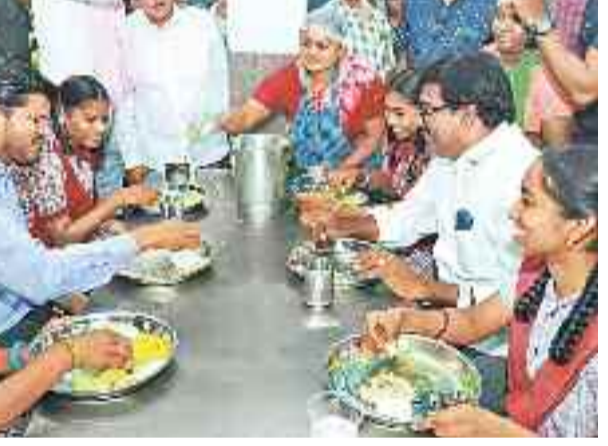
ఖమ్మంలోని రోటరీ క్లబ్ ఉన్నత పాఠశాలలో విద్యార్థులతో కలిసి అల్పహారం స్వీకరిస్తున్న మంత్రి పువ్వాడ, కలెక్టర్ వీవీ గౌతమ్