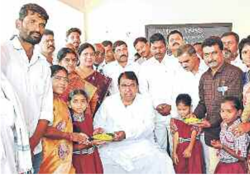
కామారెడ్డి జిల్లా బాన్సువాడ మండలం జక్కల్ దాని తండాలో సీఎం అల్పహారం పథకాన్ని ప్రారంభిస్తున్న రాష్ట్ర శాసనసభా స్పీకర్ పోచారం శ్రీనివాసరెడ్డి