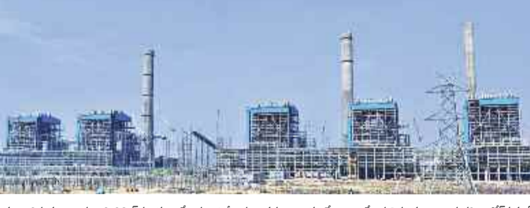
యాదాద్రిలోని యాదాద్రి రిఫైన్మెంట్ ప్లాంట్ కు సంబంధించి కేంద్ర పర్యావరణ శాఖ లేఖ రాసినా స్పందించని కేంద్ర లింపి, పర్యావరణ శాఖ

అను వాదిస్తున్న న్యాయవాది రిక్విరీడతలకు అమెరికన్ సంస్థల నుంచి నిధులు వస్తున్నాయనే ఆరోపణలు ఉండటం గమనార్హం. ఈ నేపథ్యంలో విద్యుత్తు కేంద్రానికి సంబంధించిన సివీల్ పనులు చేపట్టాలని, కమిషన్ సింగ్ మాత్రం నిలిపివేయాలని ఎన్టీపీఎస్ అడిగింది. ఈ సందర్భంగా కేంద్ర పర్యావరణ, అటవీ శాఖకు ఎన్టీపీఎస్ పనుల సూచనలు చేసింది. ఆయా సూచనలను, అధ్యయనాలను టీఎన్ జెస్కో తొమ్మిది నెలల్లోనే పూర్తిచేసి, కేంద్రానికి సమర్పించింది. ఈ అధ్యయనాలకు అనుగుణంగా అవసరమనుకుంటే రిఫైన్మెంట్ గడువు ఆపివేయాలని, కేంద్రానికి సంబంధించిన సివీల్ పనులు చేపట్టాలని, కమిషన్ సింగ్ మాత్రం నిలిపివేయాలని ఎన్టీపీఎస్ అడిగింది. ప్రముఖ పర్యావరణ న్యాయ ఘోషించేందుకు పూర్తిగా అనుమతులను ఇవ్వకపోవడం కారణంగా కేంద్రం నిరాశానంగా ఉంది. టీఎన్ జెస్కో యుద్ధప్రాతిపదికన పనులను ప్రారంభించారు. అయితే కరోనా మహమ్మారి తోపాటు చెన్నైలోని నేషనల్ గ్రీన్ ట్రిబ్యునల్ (ఎన్టీపీఎస్) రెండు సంవత్సరాల నిర్ణయం (ఎన్టీపీఎస్) వేసిన కేంద్రం కారణంగా నిర్ణయం కోరిక జాప్యం జరిగింది. కేసులు వేసిన ముంబైకి చెందిన కర్పరేషన్ యాక్టివ్ ట్రస్ట్, విశాఖపట్టణానికి చెందిన సముద్ర సంస్థల కేసు