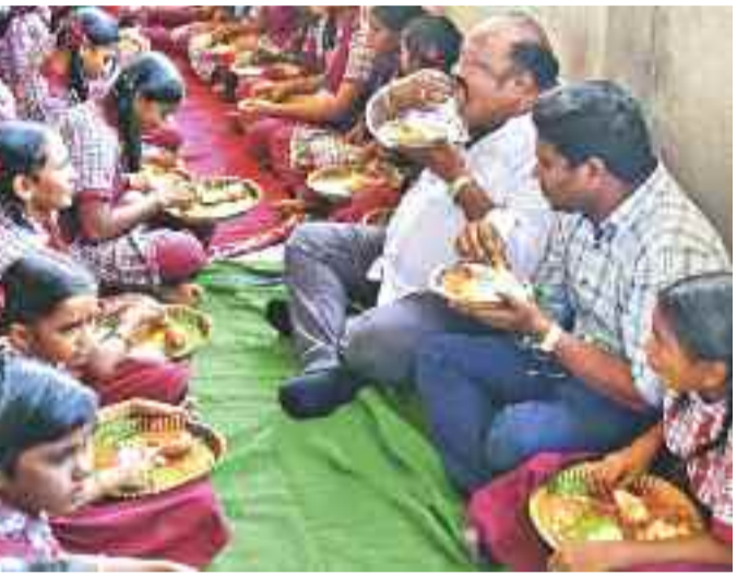
కరీంనగర్ మండలం మొగ్గంపూర్ జడ్చీ ఉన్నత పాఠశాలలో విద్యార్థులతో కలిసి అల్పహారం చేస్తున్న మంత్రి గంగుల కమలాకర్, కలెక్టర్ బీ గోపి