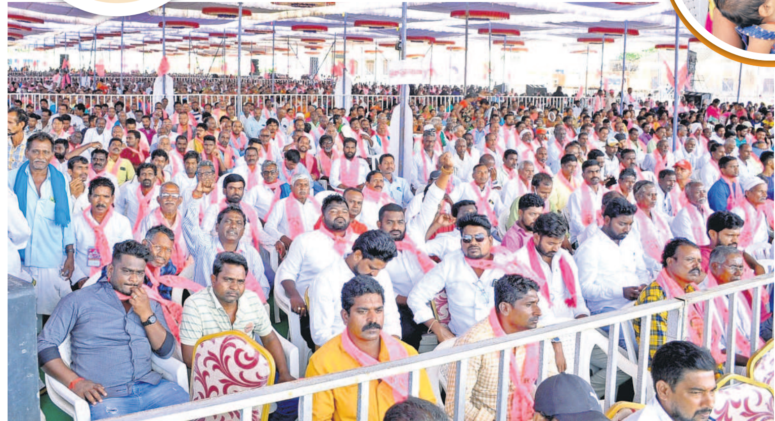
కోరుట్ల: బహిరంగ సభకు హాజరైన ప్రజలు