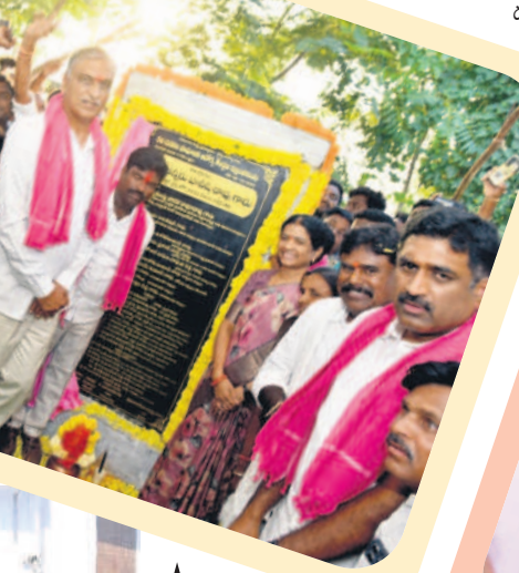
ఇల్లంతకుంట: 50 పడకల దవాఖాన శిలాఫలకాన్ని అవిష్కరిస్తున్న మంత్రి హరిశ్చంద్రావు, ఎమ్మెల్యే రసమయి బాలకిషన్