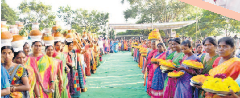
ఇల్లంతకుంట: బతుకమ్మ, బోనాలతో మహిళల స్వాగతం