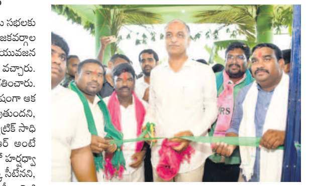
ఇల్లంతకుంట: మార్కెట్ యార్డును ప్రారంభిస్తూ..