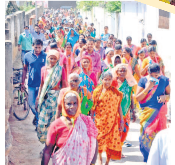
కోరుట్ల: బహిరంగ సభకు తరలివచ్చిన ప్రజలు