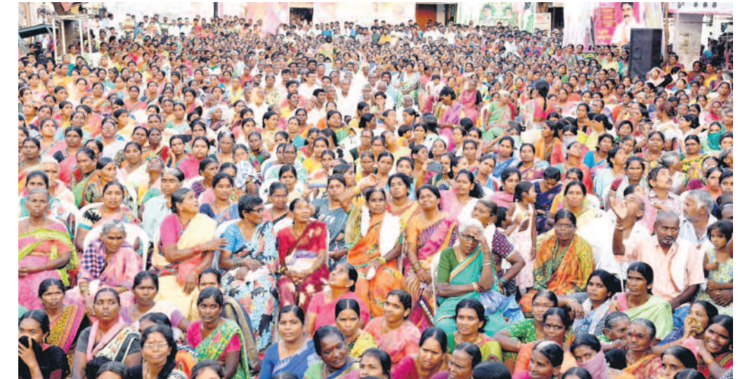
ఇల్లంతకుంటలో బహిరంగ సభకు అనేకంగా హాజరైన ప్రజలు