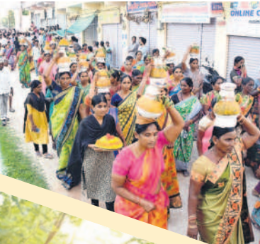
ఇల్లంతకుంట: బోనాలతో వస్తున్న మహిళలు