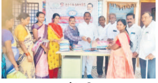
లింగపల్లిలో సర్పంచ్ సాయిలు