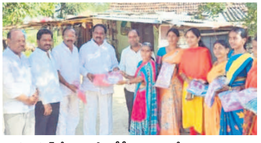
రాఘవాపూర్లో కామారెడ్డి ఎంపీపీ పిప్పిరి ఆంజనేయులు తదితరులు..