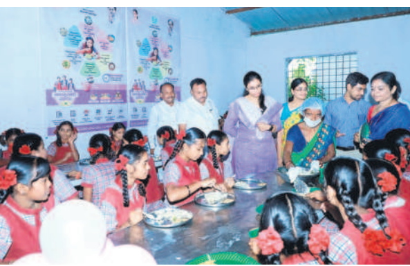
బోర్ : విద్యార్థులతో మాట్లాడుతున్న ఆదిలాబాద్ అధికార కలెక్టర్ ఖుస్సామియా