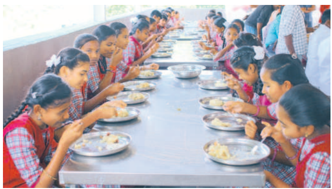
ఆదిలాబాద్ రూరల్ మండలం పాపర్లలోని జడ్డి పాఠశాలలో టిఫిన్ చేస్తున్న విద్యార్థులు