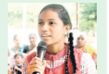
-సలోని, తొమ్మిదో తరగతి

నేను ఉదయం ఇంటి నుంచి తినకుండానే వచ్చేదాన్ని. ఒక్కోసారి మన్ను ఆకలయ్యేది. ఇప్పుడు సీఎం అల్పాహారంతో బడిలోనే టిఫిన్ చేయొచ్చు. ఇంట్లో అంత పొద్దున్నే టిఫిన్ చేయాలన్నా ఇబ్బంది. ముఖ్యమంత్రి అల్పాహారం పథకంతో ఇప్పుడు ఇబ్బంది లేదు. ముఖ్యమంత్రి కేసీఆర్ కు ధాన్యం..