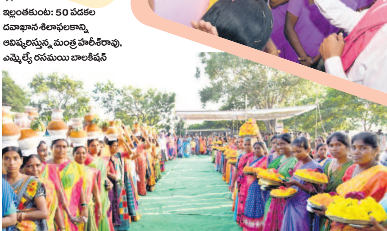
ఇల్లంతకుంట: బహుకమ్మ, బోనాలతో మహిళల స్వాగతం

ఇల్లంతకుంట: మహిళా సంఘ భవనాన్ని ప్రారంభిస్తూ..