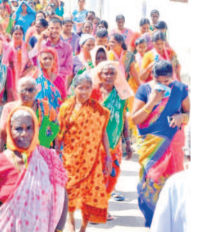
కోరుట్ల: బహిరంగ సభకు తరలివస్తున్న ప్రజలు