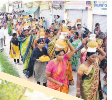
ఇల్లంతకుంట: బోనాలతో వస్తున్న మహిళలు