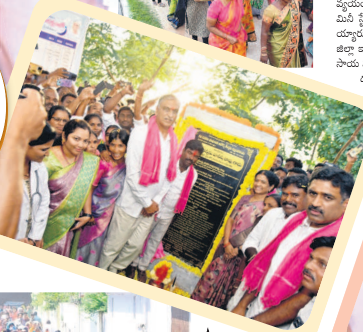
ఇల్లంతకుంట: 50 పడకల దవాఖాన శిలాఫలకాన్ని అవిష్కరిస్తున్న మంత్రి హరీశ్ రావు, ఎమ్మెల్యే రసమయి బాలకిషన్