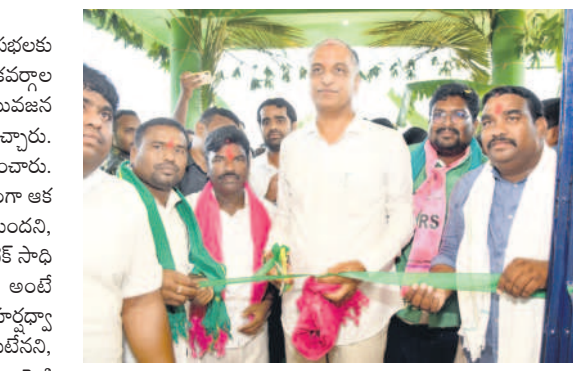
ఇల్లంతకుంట: మార్కెట్ యార్డును ప్రారంభిస్తూ..