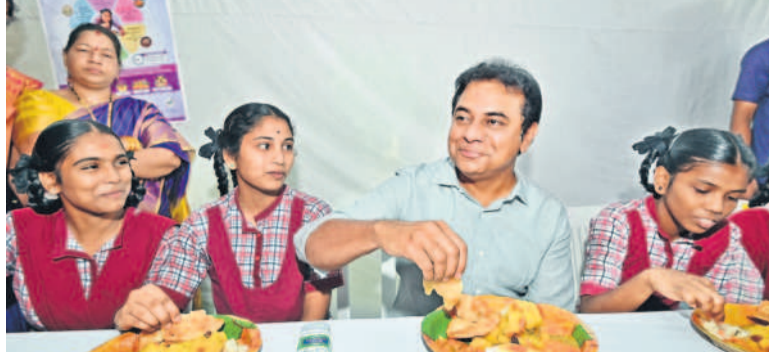
హైదరాబాద్ వెస్ట్ మార్కెట్ పట్టిలోని మునగ రామ్మోహన్ రావు ప్రభుత్వ ఉన్నత పాఠశాలలో విద్యార్థులతో కలిసి బ్రేక్ ఫాస్ట్ చేస్తున్న మంత్రి కేటీఆర్

హైదరాబాద్ సీటీబియూలో, అక్టోబర్ 6 (నమస్తే తెలంగాణ): బంగారు తెలంగాణలో పోషకాహార లోపం అనవశ్యక నిర్మూలించడమే రాష్ట్ర సర్కారు లక్ష్యం చేశారు. మంత్రి కే తారకరామారావు పేర్కొన్నారు. 1 నుంచి 10వ తరగతి విద్యార్థుల కోసం తెలంగాణ సర్కారు ప్రతిష్టాత్మకంగా తీసుకొచ్చిన ‘సీఎం బ్రేక్ ఫాస్ట్’ పథకాన్ని శుభ్రవారం హైదరాబాద్ వెస్ట్ మార్కెట్ పట్టిలోని మునగ రామ్మోహన్ రావు ప్రభుత్వ ఉన్నత పాఠశాలలో కేటీఆర్ ప్రారంభించారు. విద్యార్థులతో కలిసి అల్యాహారం చేశారు. ఈ సందర్భంగా ఆయన మాట్లాడుతూ రాష్ట్రవ్యాప్తంగా 23 లక్షల మంది విద్యార్థులకు ప్రయోజనం చేకూరేలా పథకాన్ని అమలుచేస్తున్నట్లు చెప్పారు. బ్రేక్ ఫాస్ట్ రుచికరంగా ఉండని, మెనూ బాగుండని కీటాబీచ్చారు. మెనూ ప్రకారం అల్యాహారం అంది