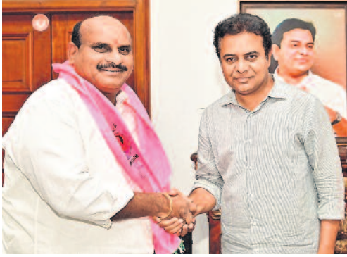
మెడక్ డీసీసీ అధ్యక్షుడు కంఠారెడ్డి తిరుపతిరెడ్డికి కందువా కప్పి బీఆర్ఎస్లోకి స్వాగతిస్తున్న పార్టీ వర్కింగ్ ప్రెసిడెంట్ కేటీఆర్

పవీ, తెలంగాణ రాష్ట్రాలకు లేఖలో వెల్లడి అటార్నీ జనరల్ సలహా ఆధారంగా నిర్ణయం సింగరేణిపై ఆంధ్రప్రదేశ్ పవీకి ఇక పుల్స్టాప్ హైదరాబాద్, అక్టోబర్ 6 (నమస్తే తెలంగాణ): సల్లబంగారు సిరులను కడుపులో దాచుకొన్న సింగరేణి కాలరీస్ పూర్తిగా తెలంగాణకు చెందుతుందని కేంద్ర ప్రభుత్వం స్పష్టంచేసింది. సింగరేణిపై ఆంధ్రప్రదేశ్ ప్రభుత్వానికి ఎలాంటి అధికారం లేదని తేల్చిచెప్పింది. ఈ మేరకు తెలంగాణ, పవీ ప్రభుత్వాలకు కేంద్ర హాం శాఖ లేఖ రాసింది. పవీలో సింగరేణికి ఎలాంటి బొగ్గు గనులు లేనందున, ఆ సంస్థ పూర్తిగా విస్తరించి ఉన్న తెలంగాణకే అది సాంకేతిక అటార్నీ జనరల్ తేల్చుటతో ఆయన సలహాను తుది నిర్ణయంగా పరిగణిస్తున్నామని చెప్పూ దాదాపు దశాబ్దాలంగా నలుగురు సమస్యకు పుల్స్టాప్ వెళ్లేసింది. ఉమ్మడి పవీ పునర్వ్యవస్థీకరణ తర్వాత రెండు రాష్ట్రాల మధ్య ఆస్తులు, అప్పుల విభజన సందర్భంలో సింగరేణిలో తమకూ వాటా ఉన్నదని పవీ వాదించింది. సింగరేణిపై సర్వ హక్కులూ తెలంగాణకే చెందుతాయని కేంద్ర హాం శాఖ ఎట్ట కేలకు ప్రకటించింది. రాష్ట్ర విభజన సమస్యల్లో ఒకటిగా సింగరేణిపై తెలంగాణ ప్రభుత్వం మొదటిసారి ఒకే మాటపై ఉన్నది. చట్టంలోని నిబంధనల ప్రకారం సింగరేణి తెలంగాణదేనని వాదించా పుట్టింది. బొగ్గు గనులన్న తెలంగాణలోనే ఉన్నాయని కేంద్రానికి స్పష్టం చేస్తూ వస్తున్నది. విభజన > 7వ పేజీలో