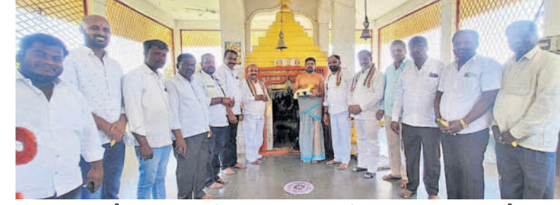
బీ కొండపూర్ లక్ష్మీనర్సింహస్వామి దేవాలయంలో పూజలు చేస్తున్న బీఆర్ఎస్ కోర్ కమిటీ సభ్యులు

బీ కొండపూర్ లక్ష్మీనర్సింహస్వామి దేవాలయంలో ప్రత్యేక పూజలు