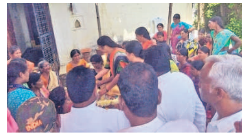
కార్యకర్త మృతదేహానికి నివాళులర్పిస్తున్న ఎమ్మెల్యే పద్మ