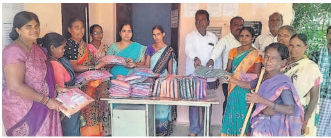
కొల్వారం: సంగాయిపేటలో మహిళలకు చీరలను పంపిణీ చేస్తున్న వైఎంపీపీ, సర్పంచ్