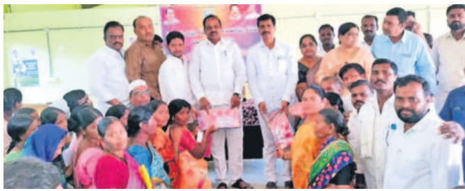
పెద్దశంకరంపేటలో మహిళలకు బతుకమ్మ చీరలు అందజేస్తున్న ఎమ్మెల్యే భూపాల్రెడ్డి