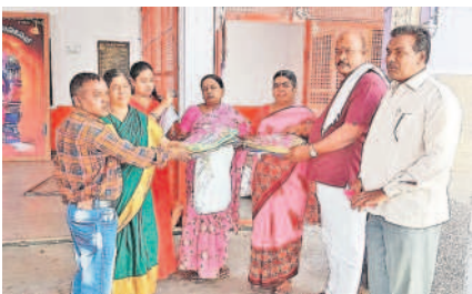
బతుకమ్మ చీరలను పంపిణీ చేస్తున్న కౌన్సిలర్ యాదగిరి