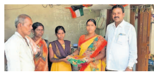
వధువుకు పుస్తెమట్టెలు అందజేత