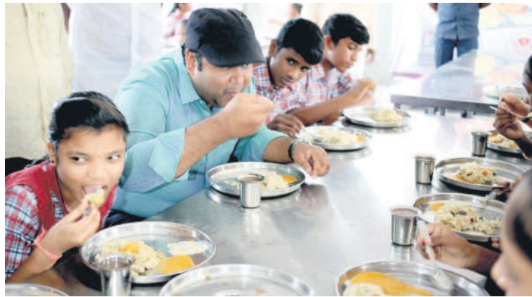
పాపర్ల జడ్పీ ఉన్నత పాఠశాలలో విద్యార్థులతో కలిసి టిఫిన్ చేస్తున్న ఆదిలాబాద్ కలెక్టర్ రామారాజు