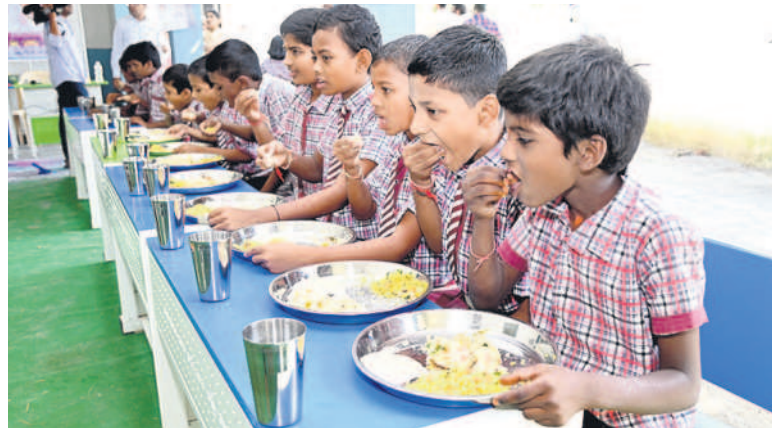
మంచెర్ల అర్బన్ : పాఠశాలలో అల్పాహారం తింటున్న విద్యార్థులు