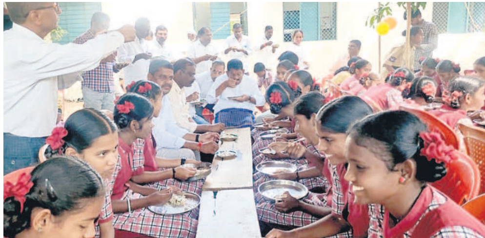
ఖైసా టౌన్ : విద్యార్థులతో కలిసి అల్పాహారాన్ని తీసుకుంటున్న ముఖ్యమంత్రి ఎమ్మెల్యే విఠల్ రెడ్డి