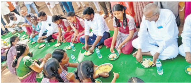
విద్యార్థులతో కలిసి అల్పాహారం భుజిస్తున్న ప్రభుత్వ వీధి గువ్వల బాలరాజు

అచ్చంపేట టౌన్, అక్టోబర్ 6 : అల్పాహార పథకం పేద విద్యార్థులకు పరమని ప్రభుత్వ వీధి, అచ్చంపేట ఎమ్మెల్యే గువ్వల బాలరాజు అన్నారు. తెలంగాణ ప్రభుత్వం ప్రతిష్టాత్మకంగా ప్రవేశపెట్టిన పాఠశాల విద్యార్థులకు అల్పాహార పథకాన్ని శుక్రవారం పట్టణంలోని జిల్లా పరిషత్ బాలికల ఉన్నత పాఠశాలలో ఆయన ప్రారంభించారు. పాఠశాలలో సరస్వతీమాతకు పూజలు చేసి ఆనంతరం విద్యార్థులతో కలిసి అల్పాహారాన్ని భుజించారు. దేశంలో