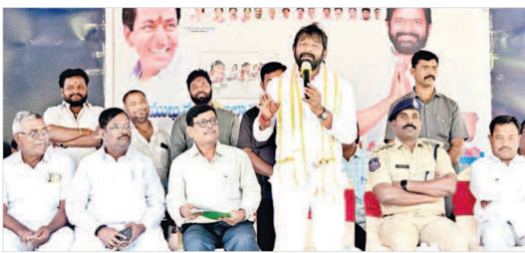
మహబూబ్ నగర్ లో మాట్లాడుతున్న మంత్రి శ్రీనివాస్ గౌడ్

■ దేశంలో ఎక్కడా లేని విధంగా తెలంగాణలో అమలు ■ క్రీడాశాఖ మంత్రి శ్రీనివాస్ గౌడ్