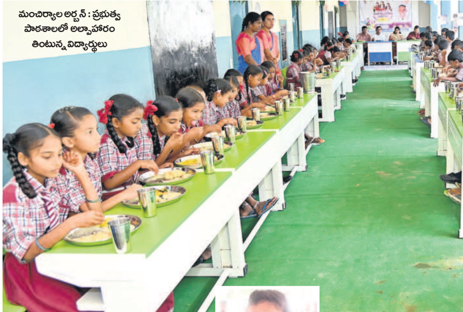
మంచిర్యాల అర్బన్ : ప్రభుత్వ పాఠశాలలో అల్పాహారం తింటున్న విద్యార్థులు