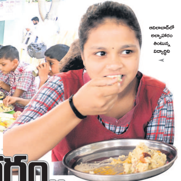
ఆదిలాబాద్ లో అల్పాహారం తింటున్న విద్యార్థిని