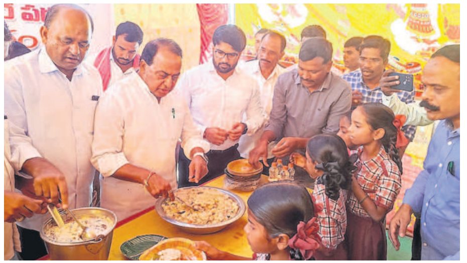
సోన్ : ప్రాథమిక పాఠశాలలో విద్యార్థులకు అల్పాహారాన్ని వడ్డిస్తున్న మంత్రి ఇంద్రకరణ్ రెడ్డి, నిర్మల్ కలెక్టర్ వరుణ్ రెడ్డి