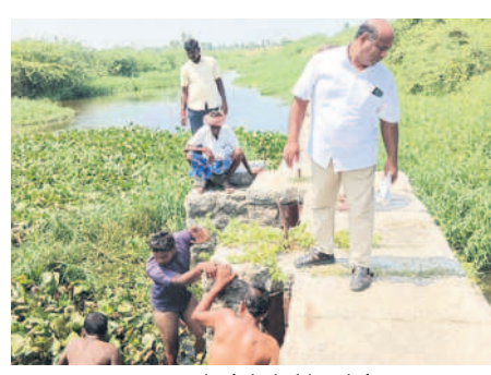
జాలవాగు వద్ద గుర్రపుడెక్కను తొలగిస్తున్న ఆయకట్టు రైతులు