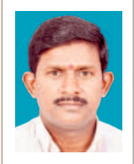
- జడ్పీటీసీ తరాల బలరాములు

సొంత జీపీ పరిధిలోని తూర్పుగూడెం గ్రామానికి సరైన రోడ్డు లేకపోవడం వల్ల గ్రామస్థులు నానా అవస్థలు పడేవారు. సమస్య పాలకులు గ్రామాల మధ్య లింకు రోడ్డు ఏర్పాటు చేయలేదు. గ్రామస్థుల కొరిక మేరకు రోడ్డు నిర్మాణ విషయాన్ని ఎమ్మెల్యే దృష్టికి తీసుకెళ్లగా వెంటనే రూ.10లక్షలు మంజూరు చేశారు. ఇప్పటికే 90వారం పనులు పూర్తయ్యాయి. ఎమ్మెల్యే సహకారంతోనే రోడ్డు నిర్మాణానికి మోక్షం లభించింది.