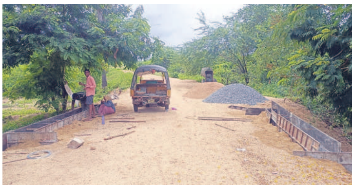
వరద కాల్వపై నిర్మాణాన్ని కల్వర్లు

కట్టంగూర్, అక్టోబర్ 6 : మండల కేంద్రానికి కూతవేటు దూరంలో ఉన్న బిల్లంకానిగూడెం గ్రామానికి మూడు దశాబ్దాలుగా సరైన రోడ్డు సౌకర్యం లేదు. దాంతో గ్రామస్థులు రాకపోకల సాగించాలంటే తీవ్ర ఇబ్బందులు పడేవారు. అత్యవసర సమయంలో ఆస్పత్రి, ఇతర అవసరాల కోసం వెళ్లాలంటే పాలాలు, చెట్లు, పుట్టల మధ్య నుంచి వెళ్లాల్సి వచ్చేది. రోడ్డు మార్గం లేక పోవడంతో కొన్నిసార్లు కట్టంగూర్లోని అంబేద్కర్ నగర్ కాలనీ నుంచి గ్రామానికి వెళ్లాలంటే కాలనీ వాసులు వెళ్లనివ్వకపోవడంతో నానా అవస్థలు పడేవారు. గ్రామానికి రోడ్డు వేయాలని గతంలో