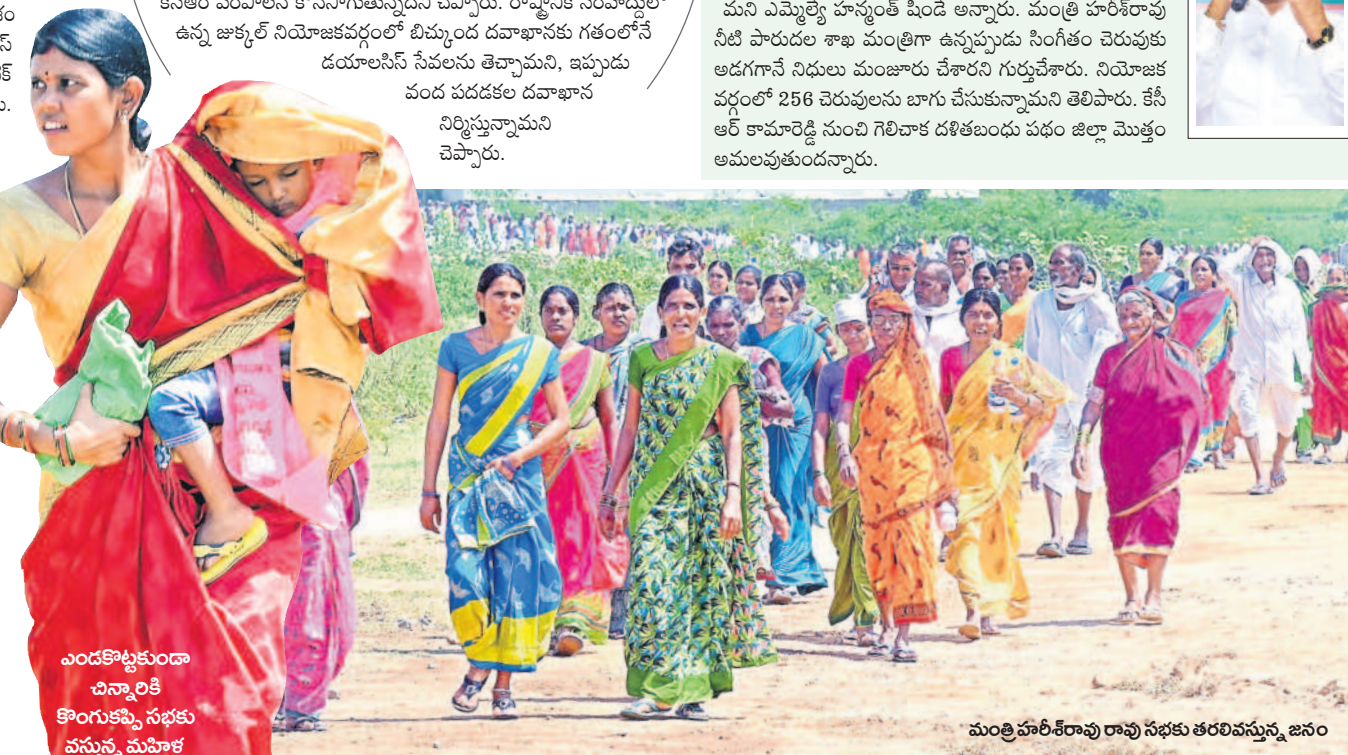
ఎండకొట్టుకుండా చిన్నారికి కొంగుకమ్మ సభకు వస్తున్న మహిళ

తనలోనే ప్రతిపక్షాలకు దిమ్మదిరిగి మ్యానిఫెస్టోను సీఎం కేసీఆర్ ప్రకటించబోతున్నారని హరీశ్ రావు తెలిపారు. ఎవరెన్ని జిమ్మి కులు చేసినా హ్యూటెక్ కొట్టి కేసీఆర్ ను డీమా వ్యక్తం చేశారు. కర్ణాటకలోని అవినీతి సమ్మెతో మోసం చేయాలని చూస్తున్నారని, ప్రజలు అప్రమత్తంగా ఉండాలన్నారు. మోదీ, రాహుల్ గాంధీ తెలంగాణపై అపారాధన ఉన్నారా? అని ప్రశ్నించారు. కేసీఆర్ రైతు పక్షపాతి అని, కరోనా సమయంలో ఎంత కష్టం ఉన్నా, రైతులకు రైతుబంధు అపోషణ ముఖ్యమంత్రి అదేశించారనే విషయాన్ని గుర్తుచేశారు. ఎన్నికల్లో మోసపోతే ఆగం అవుతామని, కైలాసం అటలిక్కే పెద్దపాము మింగే అవకాశం ఉందని, ప్రజలు అప్రమత్తంగా ఉండాలని ఆరోగ్య మంత్రి సూచించారు. దేశవ్యాప్తంగా 13 రాష్ట్రాల్లో బీజేపీ చేస్తున్న కార్మికులను ఏ ప్రభుత్వమూ పట్టించుకోలేదని, సీఎం కేసీఆర్ మాత్రమే తెలంగాణలోని కార్మికులకు రూ.2016 కోట్లను వింపస్సు అందించి, వారి ఇబ్బందులను తొలగించారని తెలిపారు. బీజేపీ జీసీ వేస్తే, కాంగ్రెస్ పుల్ల గుర్తు పెట్టి బీడీ పరిశ్రమను దెబ్బతీసిందని, కానీ కార్మికుల కుటుంబాలను కేసీఆర్ ఆదుకున్నారని తెలిపారు.