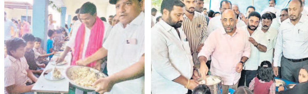
అర్నూర్ లోని రాం మంబర్ పాఠశాలలో చిన్నారులకు బ్రేక్ ఫాస్ట్ వడ్డిస్తున్న ఎమ్మెల్యే జీవన్ రెడ్డి బోధనలోని గాంధీనగర్ పాఠశాలలో అల్పాహారం అందజేస్తున్న ఎమ్మెల్యే మవ్వద్ షకీల్