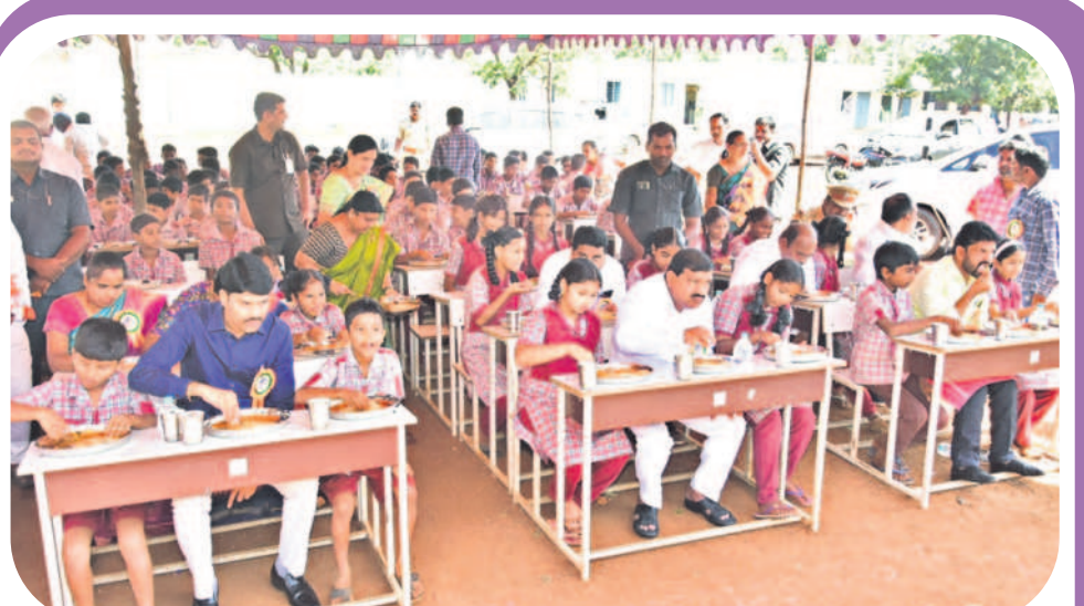
విద్యార్థులతో కలిసి టిఫిన్ చేస్తున్న మంత్రి మహేందర్ రెడ్డి, ఎమ్మెల్యే మెతుకు ఆనంద్, కలెక్టర్ నారాయణరెడ్డి