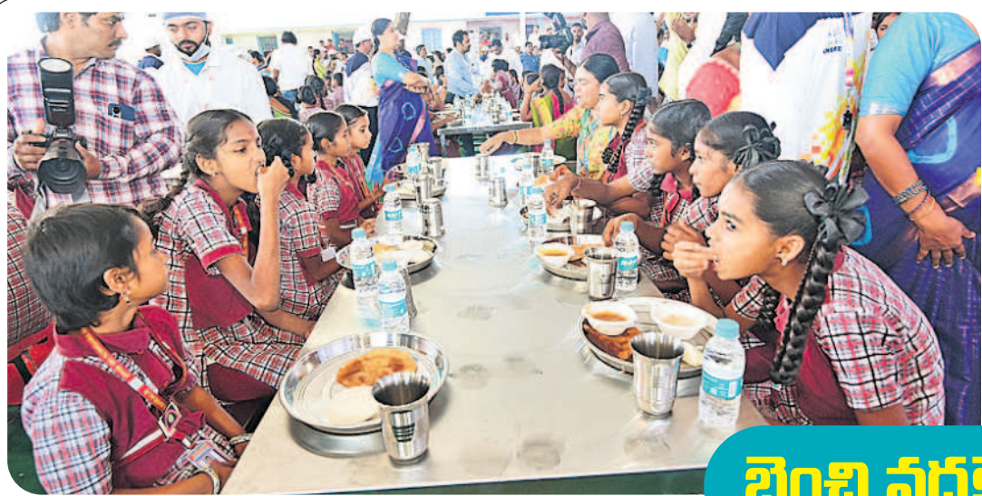
టిఫిన్ చేస్తున్న రావిర్యాల ఉన్నత పాఠశాల విద్యార్థులు