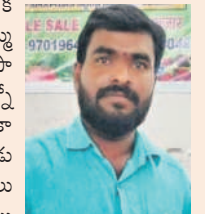
గజ్వేల్ కు కేసీఆర్ రాక ముందు కూరగాయలు అమ్ముకోవాలంటే రోడ్లపైనే వ్యాపారం కొనసాగించాం. ఎన్నో ఇబ్బందులు పడ్డాం. వర్షాకాలంలో వాన కొడుతున్నా గొండు గుప్పట్టుకొని కూరగాయలు విక్రయించిన సందర్భాలు ఉన్నాయి. తమ బాధలు తెలుసుకున్న సీఎం కేసీఆర్ సమీకృత మార్కెట్ ఒక చోట నిర్మించడంతో అన్ని విధాలా బాగుంది. ప్రతి ఒక్కరూ ఇక్కడికి వచ్చి కూరగాయలు కొనుక్కునే విధంగా మార్కెట్ కట్టించడంతో రోడ్లపై అమ్ముకునే బాధలు పోయాయి. ఇంత మంచి మార్కెట్ కట్టించిన సీఎం కేసీఆర్ కు రుణజడి ఉంటాం.

గజ్వేల్, అక్టోబర్ 6: గత ప్రభుత్వాల హయాంలో కూరగాయల వ్యాపారులు ఎండ, వాన, చలిని లెక్కచేయకుండా రోడ్లపైనే రోజూ కూరగాయల విక్రయాలు చేపట్టారు. వర్షాకాలం వచ్చిందంటే వ్యాపారుల తిప్పలు అన్నీ ఇన్నీ కావు. 2014లో గజ్వేల్ నుంచి కేసీఆర్ గెలుపొందిన తర్వాత వ్యాపారుల బాధలు తొలిగిపోయాయి. సీఎం కేసీఆర్ అనే అలోచనతో పట్టణ సడిబొడ్డు వెజ్, నాన్ వెజ్ మార్కెట్ నిర్మాణం చేపట్టడంతో వ్యాపారుల బాధలు తొలిగిపోయాయి. సీఎం కేసీఆర్ చేపట్టిన అభివృద్ధి పనులతో వ్యాపారులు హిదా అయ్యారు. దేశంలో ఎక్కడా లేని విధంగా అత్యాధునిక హంగులతో సమీకృత మార్కెట్ వినియోగంలోకి వచ్చింది. గజ్వేల్ పట్టణంలోని సమీకృత కూరగాయల (వెజ్ నాన్ వెజ్) మార్కెట్ ను సీఎం కేసీఆర్ ప్రత్యేక చౌరసతో రూ.22.85కోట్లతో ఆరు ఎకరాల విస్తీర్ణంలో నిర్మించగా 2019లో వినియోగంలోకి తీసుకొచ్చారు. ఇందులో కూరగాయలు, పూలు, పండ్లు, మాంసం, చేపలు, సూపర్ మార్కెట్ కోసం విడివిడిగా స్టాల్స్ ఏర్పాటు చేశారు. ఇందులో మొత్తం 246 స్టాల్స్ ఏర్పాటు చేయగా అందులో 52 స్టాళ్ల మాంసం, చేపల విక్రయానికి, 111 స్టాళ్ల కూరగాయలు, 83 స్టాళ్ల పూలు, పండ్లు, కల్వాల అమ్మి, షాడీముబారక్ చెక్కులు అందజేస్తారు.