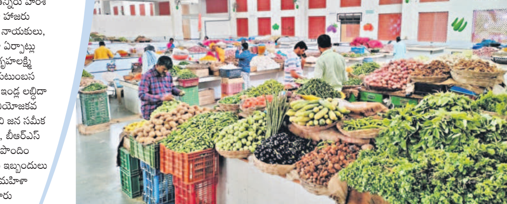
సిద్దిపేట జిల్లా గజ్వేల్ లో సమీకృత కూరగాయల మార్కెట్ లో అమ్ముతున్న కూరగాయలు

గజ్వేల్ లో రైతు బజారు కట్టించాలని ఎన్నోసార్లు అధికారులకు అర్జీలు పెట్టాం. అధికారులు, ప్రజాప్రతినిధులు ఎవరూ స్పందించలేదు. కేసీఆర్ గజ్వేల్ కు రాకతోనే మా బాధలు పోయాయి. రోజూ సగటున రూ.12లక్షల లావాదేవీలు జరుగుతున్నాయి. ఈ సమీకృత మార్కెట్ నిర్వహణ బాగుండడంతో గత కొద్ది రోజుల క్రితం ఎమ్ఎస్ఎస్ఎస్ గుర్తింపు లభించింది. ఈ మార్కెట్ పైన క్లాక్ టవర్ నిర్మాణం ఎంతో ఆదర్శంగా ముస్తాటు చేశారు.