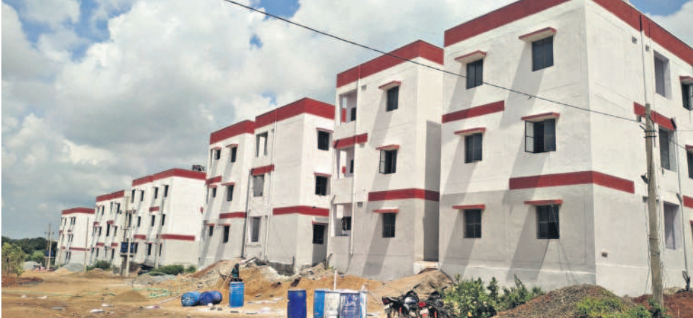
సంగారెడ్డి జిల్లా జహీరాబాద్ మున్సిపల్ పరిధిలోని హోతి(కే) శివారులో నిర్మాణం చేసిన డబుల్ బెడ్ రూమ్ ఇండ్లు