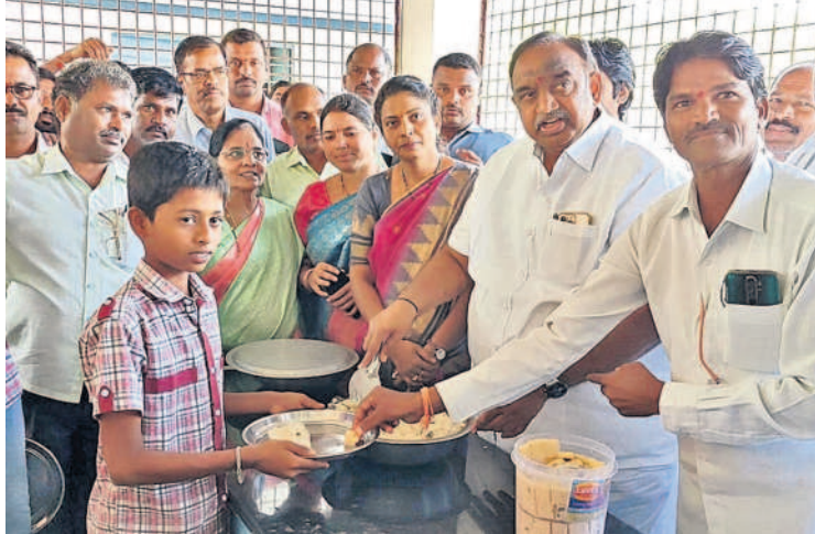
బస్సాపూర్ ఉన్నత పాఠశాలలో పిల్లలకు బ్రేక్ ఫాస్ట్ పెడుతున్న ఎమ్మెల్యే సతీశకుమార్

శుక్రవారం సిద్దిపేట జిల్లా కోహడ మండలంలోని బస్సాపూర్ ఉన్నత పాఠశాలలో సీఎం బ్రేక్ ఫాస్ట్ పథకాన్ని ఆయన ప్రారంభించారు. పిల్లలతో కలిసి బ్రేక్ ఫాస్ట్ చేశారు. కోహడ మండలంలోని నాగసముద్రాలో రూ.20 లక్షలతో నిర్మించిన గ్రామపంచాయతీ భవనాన్ని ప్రారంభించారు. అనంతరం కోహడలో రూ.2 కోట్ల 48 లక్షలతో చేసిన పనులను ప్రారంభించారు.