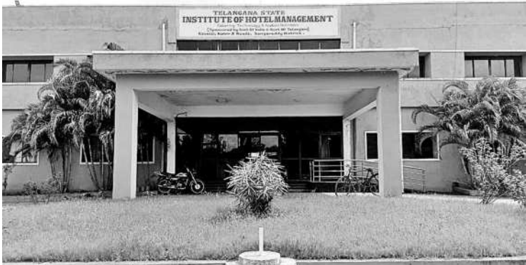
కవేలి హోటల్ మేనేజ్మెంట్ కళాశాల

కోహిల్, అక్టోబర్ 6: బీసీ యువతులకు శిక్షణ నందించి ఉపాధిమార్గం చూపించాలనే లక్ష్యంతో నీఎం కేసీఆర్ విశేష కృషి చేస్తున్నారు. ఇందులో భాగంగా జహీరాబాద్ నియోజకవర్గానికి మహిళా జ్యోతిబాపూలే హోటల్ మేనేజ్మెంట్ మహిళా గురుకుల డిగ్రీ కళాశాలను మంజూరు చేశారు. కోహిల్ మండలంలోని కవేలి జాతీయ రహదారి పక్కన ఉన్న హోటల్ మేనేజ్మెంట్ కళాశాలలో శనివారం మంత్రి హాల్ కార్యక్రమం చేతులమీదుగా తరగతులు ప్రారంభించనున్నారు. పలు ప్రాంతాలకు చెందిన మహిళా జ్యోతిబాపూలే గురుకుల కళాశాలల్లో హోటల్ మేనేజ్మెంట్లో ఇంటర్ పూర్తి చేసిన బీసీ విద్యార్థినులకు బీఎస్సీ డిగ్రీ కోర్సులో మూడు సంవత్సరాలపాటు శిక్షణనివ్వనున్నారు. శిక్షణ పొందిన యువతులకు పలు ప్రాంతాల స్టార్ హోటళ్లు, విమానాలు, బేకరీల్లో ఉపాధి కల్పించనున్నారు. తమ ప్రాంతానికి మహిళా డిగ్రీ కళాశాలను మంజూరు చేసినందుకు విద్యార్థినుల తల్లిదండ్రులు హార్షం వ్యక్తం చేస్తున్నారు.