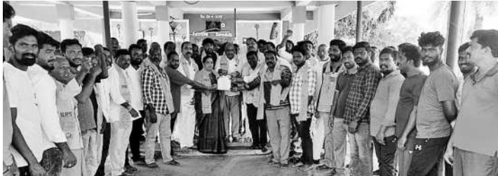
తీర్మాన ప్రతిని అందుకుంటున్న జడ్పీ చైరపర్సన్, ఎంపీపీ