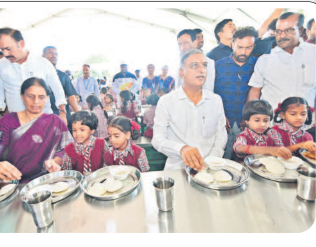
టిఫిన్ చేస్తున్న విద్యార్థులు

విద్యాల ఉన్నత పాఠశాలలో ట్రైక్ ఫాస్ట్ పథకం ప్రారంభోత్సవానికి పాఠశాల విద్యార్థులతోపాటు వారి తల్లిదండ్రులను ఆహ్వానించారు. ఈ సందర్భంగా ఏర్పాటు చేసిన ట్రైక్ ఫాస్ట్ మొదటి రోజు మెనూలో ఇడ్లీ సాంబారు, పూరీ, ఆలూకుర్రాలను అందించారు. విద్యార్థుల పక్కనే కూర్చుని వారితో కలిసి మంత్రులు హరీశ్ రావు, సలితారెడ్డి, ఇతర ప్రజాప్రతినిధులు, అధికారులు టిఫిన్ తిన్నారు. ఈ సందర్భంగా విద్యార్థులకు టిఫిన్ ను తినిపించారు. కార్పొరేట్ స్థాయిలో జోడన అందించడంతోపాటు మాడుపార్కు విద్యార్థులకు రాగి జావ, ట్రైక్ ఫాస్ట్ మధ్యాహ్న భోజనం సదుపాయాన్ని కల్పించడంపై విద్యార్థులు, వారి తల్లిదండ్రులు ఆనందాన్ని వ్యక్తం చేశారు.