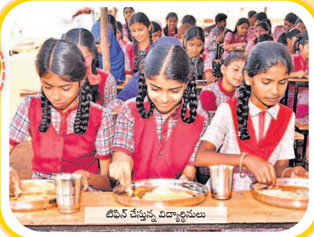
టిఫిన్ చేస్తున్న విద్యార్థులు