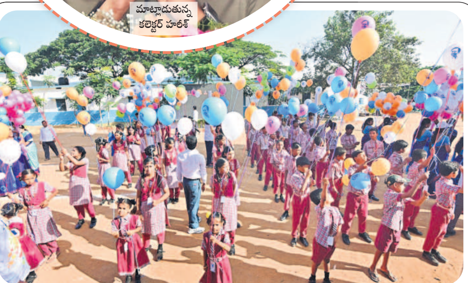
సీఎంకేసీఆర్ చిత్రంతో ఉన్న బెలున్ ను ఎగురవేస్తున్న విద్యార్థులు

రంగారెడ్డి, అక్టోబర్ 6 (నమస్తే తెలంగాణ) : సీఎం అల్పాహారం కార్యక్రమం విద్యార్థులకు గొప్ప వరమని, ఈ పథకం విద్యా వ్యవస్థలో సమూల మార్పు తెచ్చుదని రాష్ట్ర అధిక, వైద్యారోగ్య శాఖ మంత్రి తన్నీరు హరీశ్ రావు అన్నారు. రాష్ట్ర వ్యాప్తంగా అమలు చేస్తున్న 'సీఎం అల్పాహారం' పథకాన్ని శుభవారం మంత్రి హరీశ్ రావు రాష్ట్ర విద్యాశాఖ మంత్రి సలితారెడ్డితో కలిసి రంగారెడ్డి జిల్లా తుక్కుగూడ మున్సిపాలిటీలోని రావిర్యాల ఉన్నత పాఠశాల వేదికగా లాంఛనంగా ప్రారంభించారు. ఈ సందర్భంగా విద్యార్థులు చేసిన సభలో మంత్రి హరీశ్ రావు మాట్లాడుతూ సీఎం కేసీఆర్ ఏ పథకాన్ని అమలు చేసినా ప్రజా కోణంలో ఆలోచిస్తారని, అందుకే అన్ని పథకాలు విజయవంతం కావడంతోపాటు సామాజిక మార్పునకు కారణం అవుతున్నాయన్నారు. కల్యాణ లక్ష్మి పథకంలో ఇచ్చే రూ.లక్ష సాయంతో బాల్య వివాహాలు తగ్గాయన్నారు. కేసీఆర్ కిట్ వల్ల వంద శాతం ఇన్స్టిట్యూషన్ లో డెబ్బ రీలు జరుగుతున్నాయన్నారు. మిషన్ భగీరథ పథకంతో సురక్షిత తాగునీటి సరఫరా వల్ల సీజనల్ వ్యాధులు తగ్గుతున్నాయన్నారు. కేసీఆర్ అల్పాహారం పథకం విద్యార్థుల కడుపు నింపే కార్యక్రమం మాత్రమే కాదని, డ్రాప్ బెన్చెన్స్ తగ్గించి విద్యార్థులు బడి బాట పట్టించి విద్యావ్యవస్థలో విప్లవాత్మక మార్పు తెచ్చే పథకమని పేర్కొన్నారు. ట్రైక్ ఫాస్ట్ అందిస్తున్న ఏకైక రాష్ట్రం తెలంగాణ అని, వెయ్యి రెసిడెన్షియల్ స్కూల్స్ ఉన్న ఏకైక రాష్ట్రం కూడా తెలంగాణేనని అన్నారు. దసరా తర్వాత రాష్ట్ర వ్యాప్తంగా అన్ని పాఠశాలల్లో ట్రైక్ ఫాస్ట్ పథకం అమలులోకి వస్తుందన్నారు. కార్యక్రమంలో ఎంపీలు