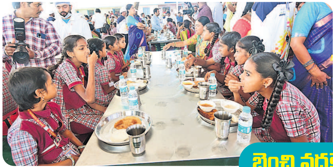
టిఫిన్ చేస్తున్న రావిర్యాల ఉన్నత పాఠశాల విద్యార్థులు