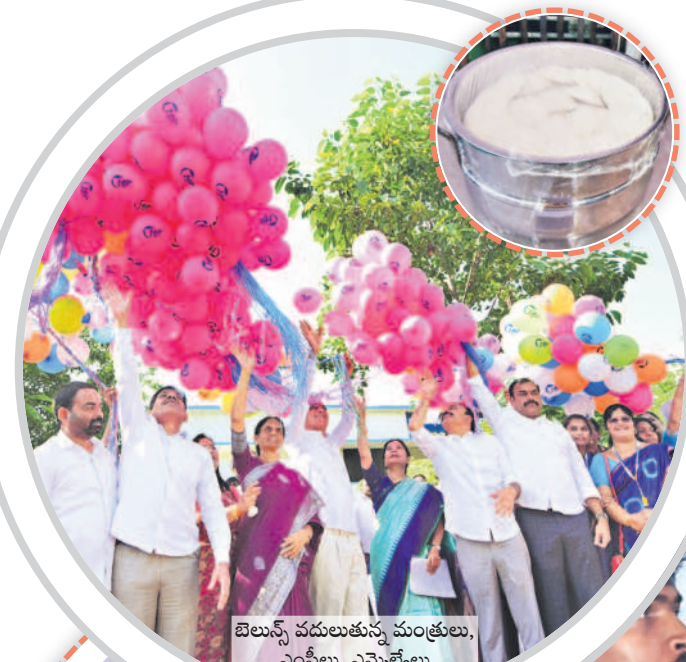
బెలున్ వదులుతున్న మంత్రులు, ఎంపీలు, ఎమ్మెల్యేలు