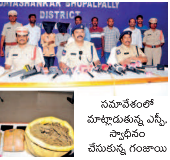
సమావేశంలో మాట్లాడుతున్న ఎస్పీ, స్వాధీనం చేసుకున్న గంజాయి