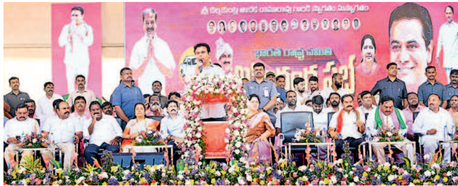
కూడా హయగ్రీవాచారి మైదానంలో జరిగిన బహిరంగ సభలో మాట్లాడుతున్న మంత్రి కేటీఆర్

తెలంగాణ ఉద్యమ ప్రతిదశలో ఉద్యమనేత కేసీఆర్ వెంట నడిచిన వినియోగదారుల మార్గం లీడర్ అని మంత్రి కేటీఆర్ అన్నారు.