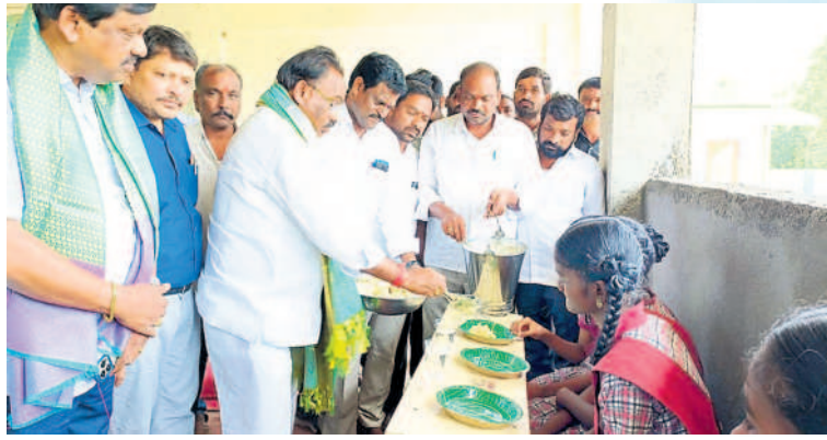
చందూరు మండలం బంగారిగడ్డ జిల్లా పరిషత్ ఉన్నత పాఠశాలలో విద్యార్థులకు టిఫిన్ వడ్డిస్తున్న ఎమ్మెల్యే కాసుకుంట్ల ప్రభాకరరెడ్డి