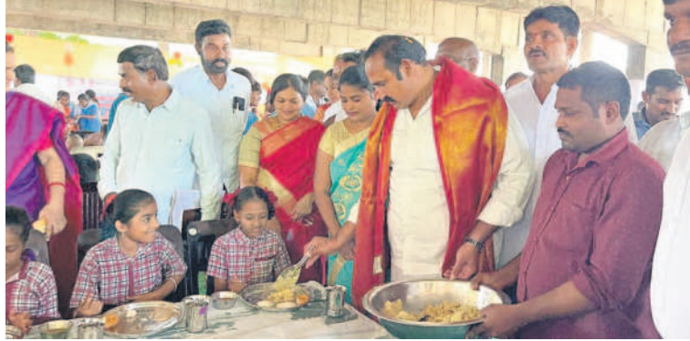
కోడూడ : అంబేద్కర్ కాలనీ ప్రభుత్వ పాఠశాలలో విద్యార్థులకు అల్పహారం అందిస్తున్న ఎమ్మెల్యే మల్లయ్యయ్యారావు