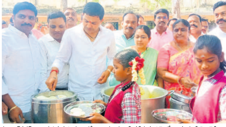
హుజూరనగర్ బాలుర ఉన్నత పాఠశాలలో విద్యార్థులకు ఇడ్లీ వడ్డిస్తున్న ఎమ్మెల్యే శాంపూడి సైబరెడ్డి