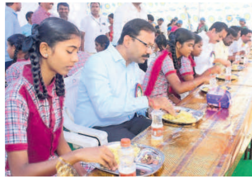
వలిగొండ : శ్రీ వెంకటేశ్వర ప్రభుత్వ ఉన్నత పాఠశాలలో విద్యార్థులతో కలిసి ఉపాహారం అందిస్తున్న ఎమ్మెల్యే కలెక్టర్ వినయ్ కిషోర్ రెడ్డి