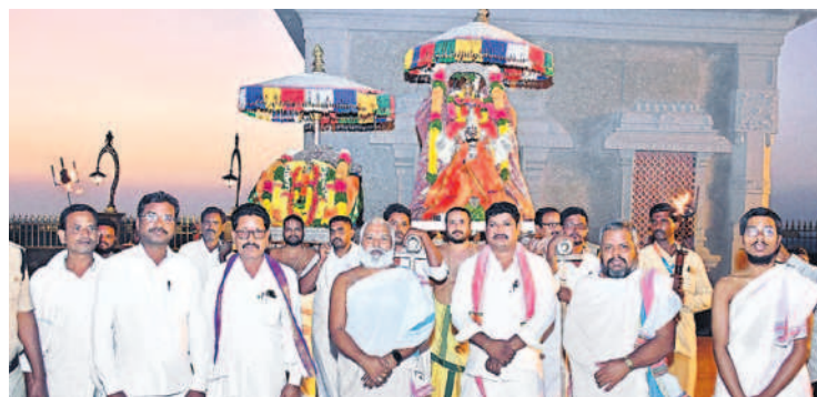
యాదగిరిగుట్టలో లక్ష్మీనరసింహుల తిరువీధి సేవోత్సవం నిర్వహిస్తున్న అర్చకులు