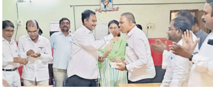
కోదాడకు రెండు కోర్టులు మంజూరు అవడంతో స్వీట్లు తినిపించుకుంటున్న బార్ అసోసియేషన్ సభ్యులు, న్యాయవాదులు