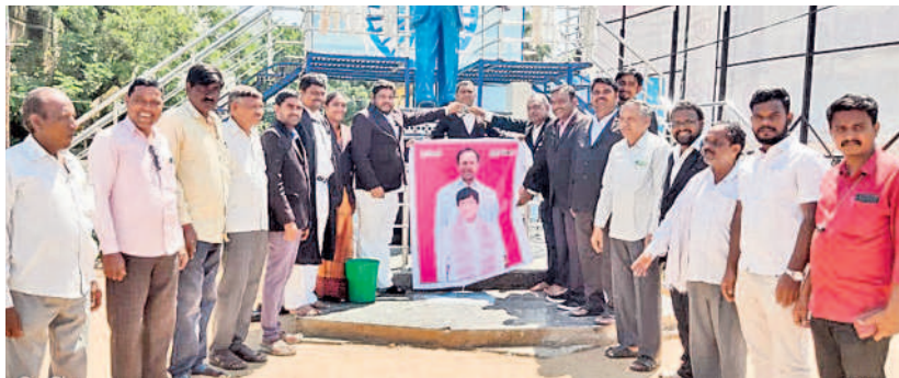
సీఎం కేసీఆర్ చిత్తపటాలికి పాలాభిషేకం చేస్తున్న న్యాయవాదులు

స్టేషన్ ఘనపూర్, అక్టోబర్ 7: స్టేషన్ ఘనపూర్ డివిజన్ కేంద్రంలో కోర్టు ఏర్పాటుకు రాష్ట్ర ప్రభుత్వం ఉత్తర్వులు మంజూరు చేసింది. ఈ నేపథ్యంలో మండల ప్రజలు సీఎం కేసీఆర్, రాష్ట్ర న్యాయశాఖ మంత్రి అల్లూరి ఇంద్రకరణ్ రెడ్డికి బీఆర్ఎస్ నియోజకవర్గ అభ్యర్థి ఎమ్మెల్సీ కడియం శ్రీహరి శనివారం ఒక ప్రకటనలో కృతజ్ఞతలు తెలిపారు. ప్రత్యేక రాష్ట్రం సాధించాక తెలంగాణ ప్రభుత్వం స్టేషన్ ఘనపూర్ను డివిజన్ గా మార్చిందని గుర్తు చేశారు. ఇందులో భాగంగా స్టేషన్ ఘనపూర్కు కోర్టును మంజూరు చేయాలని గత సంవత్సరం మే నెలలో మంత్రి ఇంద్రకరణ్ రెడ్డికి ప్రతిపాదనలు పంపారని, దీనికి సీఎం కేసీఆర్ సానుకూలంగా స్పందించి కోర్టును మంజూరు చేశారన్నారు. ఈ నేపథ్యంలో సీఎం కేసీఆర్ కు ఎమ్మెల్సీ కడియం శ్రీహరి కృతజ్ఞతలు తెలిపారు.