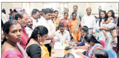
ప్రజలకు వైద్య పరిక్షలు చేస్తున్న డాక్టర్లు

కాశీబుగ్గ, అక్టోబర్ 7 : నిరుపేదలకు ఉచితంగా వైద్య సేవలు అందించడం అభినందనీయమని పాస్టర్ పెరుమాండ్ల ప్రవీణ్ అన్నారు. లేబర్ కాలనీలోని సీబీసీ