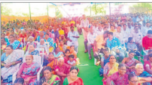
సమావేశానికి హాజరైన గ్రామస్థులు

హార్యాస, మహారాష్ట్ర, పంజాబ్ రాష్ట్రాలు ముందు ఉండేవని, నేడు దేశం గర్వించేలా వరి పంట సాగులో తెలంగాణ మొదటి స్థానంలో ఉందన్నారు. అన్ని గ్రామాల్లో కొనుగోలు కేంద్రాల ద్వారా రైతుకు గిట్టుబాటు ధర కల్పించినట్లు తెలిపారు. రాష్ట్రం అభివృద్ధి చెందాలంటే గ్రామాలు అభివృద్ధి చెందాలన్నారు. ఇప్పటికే గ్రామాల్లో చాలా అభివృద్ధి పనులు చేశామన్నారు. దేశంలో ఏ రాష్ట్రంలో లేని పలు సంక్షేమ పథకాలను ప్రవేశపెట్టామని పేర్కొన్నారు. ఆడబిడ్డలకు కల్యాణలక్ష్మి, ప్రభుత్వ దవాఖానలో ప్రసవం అయిన వారికి కేసీఆర్ కిట్ పథకం అమలు చేసిన ఘనత సీఎం కేసీఆర్ కే దక్కుతుందన్నారు. నియోజకవర్గం నుంచి సీఎం కేసీఆర్ బీఆర్ఎస్ పార్టీ అభ్యర్థిగా తనను ఆశీర్వాదించి మీ ముందుకు పంపారని కడియం శ్రీహరి తెలిపారు. నిండు మనసుతో తనను ఆశీర్వాదించాలని కోరారు. గెలిచిన ఆరు నెలల్లోనే మీకు ఇచ్చిన హామీలను అమలు చేసి చూపిస్తానని తెలిపారు. ఎమ్మెల్యేగా ఎలాంటి తలవంపులు వచ్చే పనిని చేయనన్నారు. ప్రజలు తల ఎత్తుకునేలా తన పనితనం ఉంటుందన్నారు. అంతేకాకుండా సంక్షేమ పథకాలు అర్జులైన వారికి అందేలా చూస్తానని హామీ ఇచ్చారు. దళిత బంధు పథకానికి నిజమైన లబ్ధిదారులను గుర్తించి, మధ్యస్థత్వం లేకుండా, పైసా ఖర్చు లేకుండా అందేలా చూస్తానన్నారు. అంతే కాకుండా నియోజకవర్గానికి గృహలక్ష్మి పథకంలో 3000 ఇండ్లు మంజూరయ్యాయని, సీఎం కేసీఆర్ తో స్వయంగా మాట్లాడి మరో మూడు వేల కలిపి మొత్తంగా ఆరు వేల ఇండ్లు తీసుకువస్తానని హామీ ఇచ్చారు. వీటిని నిజమైన లబ్ధిదారులకు అందజేస్తానని తెలిపారు. సంక్షేమ పథకాల అమలులో ఎలాంటి లాభం కోసం పని చేయనని