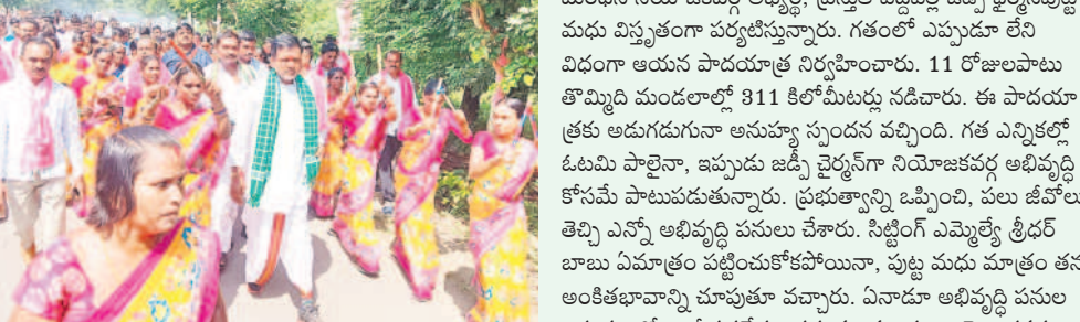
ఈనెల 5న ప్రజా ఆశీర్వాద యాత్రలో భాగంగా కమాన్ ఫ్యూరిలో ర్యాలీగా వస్తున్న జి.పి.వై.పి. పుట్ల మధుకర్