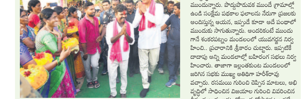
ఈనెల 6న ఇల్లంతులపల్లిలో బహిరంగ సభకు వస్తూ మహిళా లకు నమస్కరిస్తున్న మంత్రి హరీశ్ రావు, ఎమ్మెల్యే రసమయి