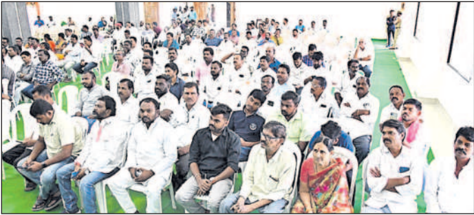
హాజరైన దళిత సంఘాల నాయకులు