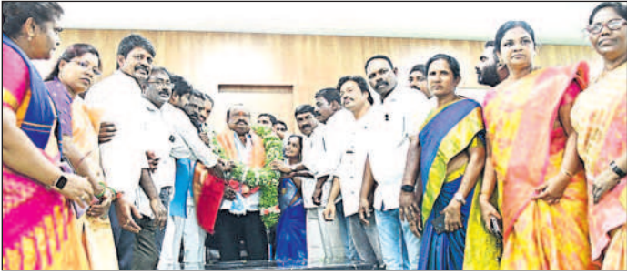
మంత్రిని సత్కరిస్తున్న దళిత సంఘాల నాయకులు