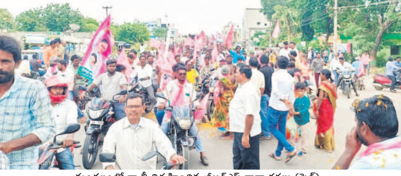
మండలంలో ర్యాలీ నిర్వహించిన బీఆర్ఎస్ కార్యకర్తలు (ఫైల్)

కుటుంబాలు ఉన్నట్లు సకలజనుల సర్వేలో తేలింది. వీటితోపాటు ప్రస్తుతం మరెక్కాని కుటుంబాలు వెలగే అవకాశం ఉందని అధికారులు చెబుతున్నారు. కుటుంబాల వివరాలు ఆళ్లపాడు- 106, బోసకల్లు- 450, బ్రాహ్మణపల్లి- 269, చిన్నబీరపల్లి- 199, చిరునోముల- 419, చొప్పకల్లుపాలెం- 193, గార్లపాడు- 77, గోవిందాపురం- ౭- 89, జానకిపురం, సీతానగరం- 285, కలకొట- 427, గోవిందాపురం, లక్ష్మీపురం- 490, మోటమర్ర- 309, ముప్పి కుంట్ల- 175, నారాయణపురం- 176, పెద్దబీరపల్లి- 133, రామాపురం- 75, రాపల్లి- 99, రావి నూతల- 368, రాయన్నపేట- 194, తూటి కుంట్ల- 389, గుహాల్లో 4,922 ఎస్సీ కుటుంబాలు జీవనం కొనసాగిస్తున్నాయి.