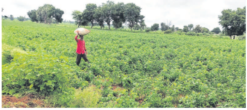
ధర్మాశంకర్ గోకర్కాయ తోట