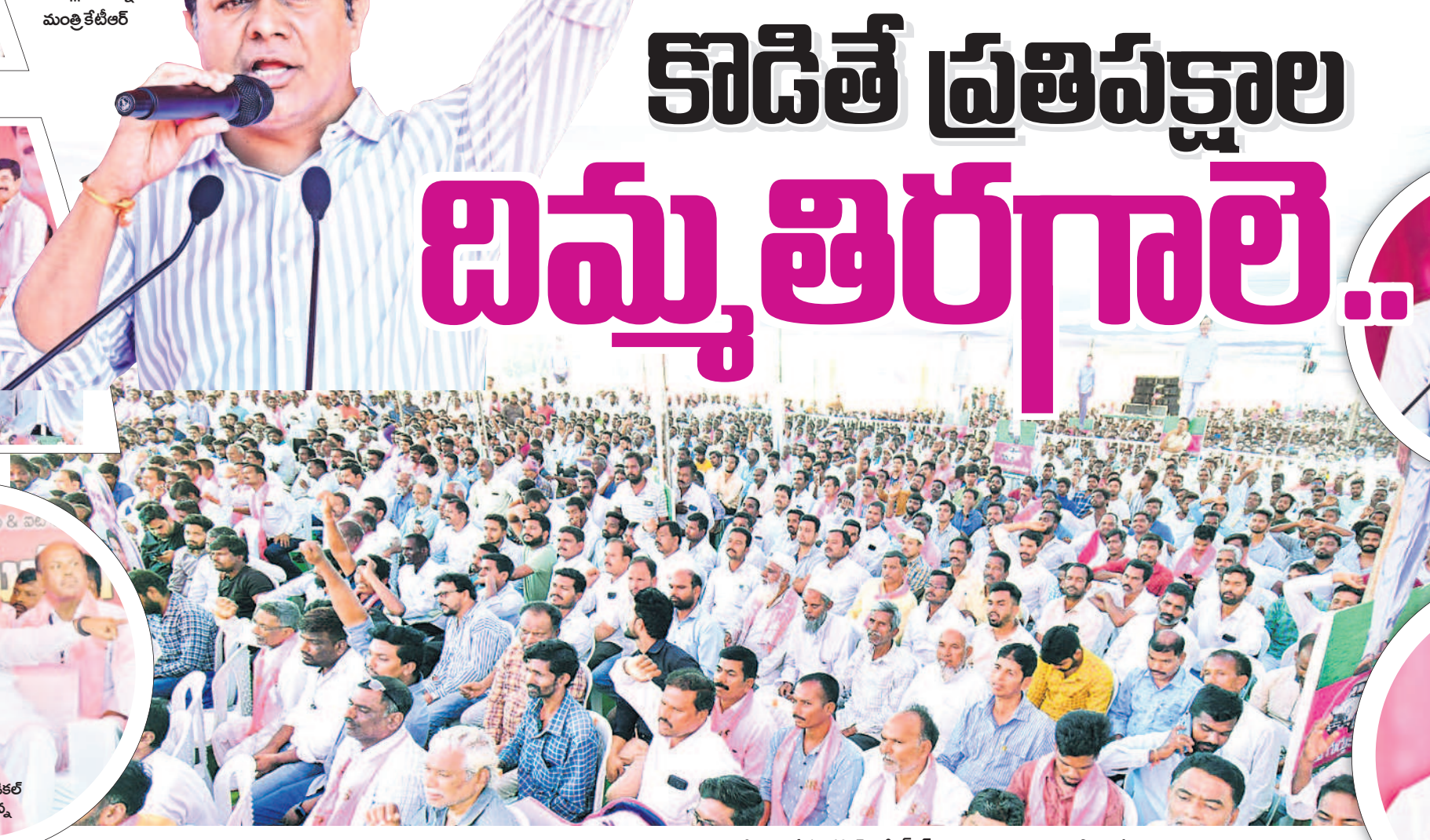
నిజామాబాద్, అక్టోబర్ 7 (నమస్తే తెలంగాణ ప్రతినది) / కామారెడ్డి : బహిరంగ సభకు హాజరైన బీఆర్ఎస్ నాయకులు, కార్యకర్తలు, స్థానిక ప్రజలు