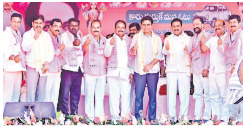
వేదికపై విజయకేశవం చూపుతున్న మంత్రి కేటీఆర్, ఎంపీ బీజీపాటిల్, విప్ గోవర్ధన్ తదితరులు