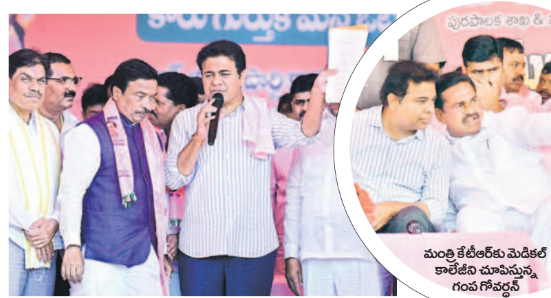
పక్కనే తీర్మానాలను చూపుతున్న మంత్రి కేటీఆర్, పక్కనే ఉద్ధాఠాడమి రాష్ట్ర వైద్యనీ ముఖ్యమంత్రి, ఎంపీ బీజీపాటిల్