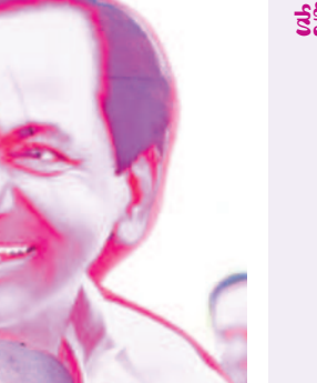
కేసీఆర్ గెలుపుతో మరింత అభివృద్ధి