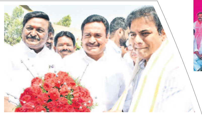
మంత్రి కేటీఆర్ కు స్వాగతం పలుకుతున్న ప్రభుత్వ విప్ గంపగోవర్ధన్, బీఆర్ఎస్ రాష్ట్ర నేత వీజీబాద్