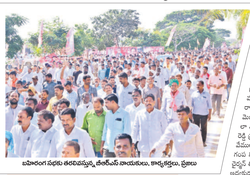
బహిరంగ సభకు తరలివస్తున్న బీఆర్ఎస్ నాయకులు, కార్యకర్తలు, ప్రజలు

బీఆర్ఎస్ శ్రేణుల్లో జోష్.. బీఆర్ఎస్ పార్టీ పర్మిట్ ప్రాసెసింగ్ కల్పనకు కారక రామాచారి కామారెడ్డి నియోజకవర్గ పర్మిట్ విజయవంతమైంది. మూడున్నర గంటల పాటు కామారెడ్డి పట్టణంలో పర్యటించిన ఆయన.. బహిరంగ సభ ద్వారా శ్రేణుల్లో జోష్ నింపారు. తనదైన శైలిలో సుదీర్ఘ ప్రసంగంతో వచ్చే ఎన్నికల్లో పార్టీ శ్రేణులు ఏ విధంగా సమయాత్మకం కావాల్సి దానిని సలహాలు సూచనలు అందించారు.