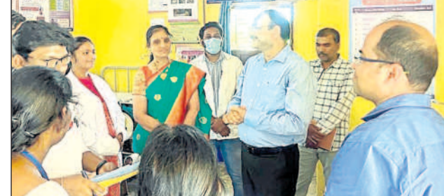
కొండపాకలో హెల్త్ వెల్ నెస్ సెంటర్ ను పరిశీలిస్తున్న జాతీయ బృందం