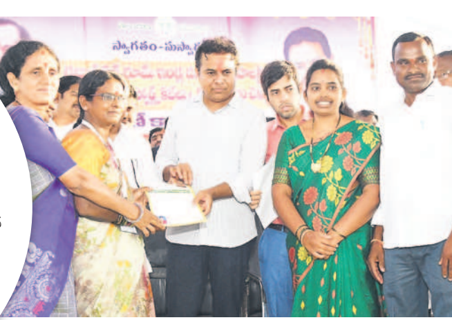
ఈనెల 3న సిరిసిల్లలో మహిళా కు ఇంటి పట్టాను అందజేస్తున్న మంత్రి కేటీఆర్

సిరిసిల్ల నియోజకవర్గంలో ప్రస్తుత అభ్యర్థి, మంత్రి కేటీఆర్ తిరుగులేని శక్తిగా ఎదిగాడు. గత ఎన్నికల సమయంలో 89,009 ఓట్ల మెజారిటీతో రికార్డు సృష్టించారు. ఈ పరిస్థితుల్లో ఇక్కడ ఇతర పార్టీల నుంచి ఎవరూ పోటీచేసినా డిమాండ్ దక్కలే చాలన్నట్లుగా ప్రచారం జరుగుతున్నది. అయినా మంత్రి కేటీఆర్, తనపైన శైలిలో ప్రచారం చేస్తూనే ఉన్నారు. నిజానికి అందరికంటే ముందుగానే కేటీఆర్ తండ్రిగట్టే సభలో తన ఎన్నికల ప్రచారాన్ని మొదలు పెట్టారు. ఇప్పటికే చేసిన అభివృద్ధి పనులతోపాటు ఇంకా నియోజకవర్గానికి అవసరమైన అనేక అభివృద్ధి పనులకు ప్రారంభోత్సవాలు చేస్తూ, ప్రజల మన్ననలు పొందుతున్నారు. అభివృద్ధి, సంక్షేమాన్ని కండ్లారా చూస్తున్న ప్రజలు మరోసారి కేటీఆర్ రావాలని కోరుకుంటున్నారు. రాబోయే ఎన్నికల్లో సంపూర్ణ ఆశీర్వాదాలు అందించేందుకు సిద్ధమయ్యారు.