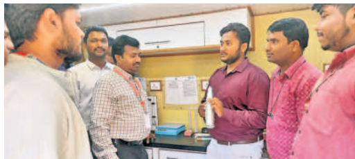
సిమెంట్ నాణ్యతా ప్రమాణాలను సంచార ప్రయోగశాలలో వివరిస్తున్న చెట్టినాడ్ ప్రతినిధులు