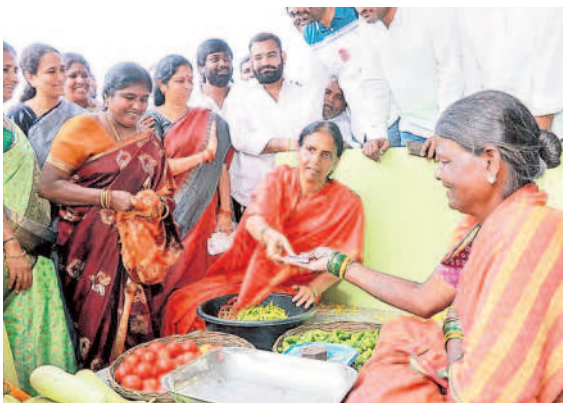
మంత్రాల చెరువు సమీపంలో డ్రీట్ వెండర్ కోసం ఏర్పాటు చేసిన పావుల దగ్గర కూరగాయలు కొంటున్న మంత్రి పి సబితా ఇంద్రారెడ్డి