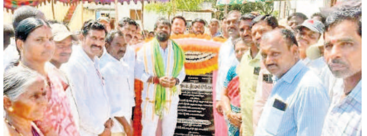
పసుగొండలో యాదవ కమ్యూనిటీ హాల్ నిర్మాణ పనులకు శంకుస్థాపన చేస్తున్న మంత్రి శ్రీనివాస్ గౌడ్

మహబూబ్ నగర్ టౌన్, అక్టోబర్ 7 : కులమతాలకు అతీతంగా అన్ని వర్గాల సంక్షేమమే లక్ష్యంగా సీఎం కేసీఆర్ ముందుకు సాగుతున్నారని ఆస్కారి, క్రీడా శాఖల మంత్రి శ్రీనివాస్ గౌడ్ అన్నారు. తిరుమలపిల్లలో నిర్మించే రెడ్డి సంఘం కన్వెన్షన్ హాల్, జేజేఆర్ గార్డెన్ సమీపంలో హజ్జ్ హౌస్, ఖుర్రేషి ఫంక్షన్ హాల్, ఏనుగొండలో యాదవ సంఘం, బోయపల్లిలో రెడ్డి సంఘం కమ్యూనిటీ హాల్, తూర్పు కమాన్ వద్ద జామియా మసీద్ సమీపంలో కమ్యూనిటీ హాల్, మార్కెట్ యార్డు సమీపంలో ఈడా ప్రహారీ పనులకు శంకుస్థాపనలు, భూమిపూజ చేశారు. కొత్తగంజిలో గ్రంథాలయాన్ని ప్రారంభించి మాట్లాడారు. అన్ని రంగాల్లో రాష్ట్రం దూసుకుపోతున్నదన్నారు. ఎన్నికల వేళ