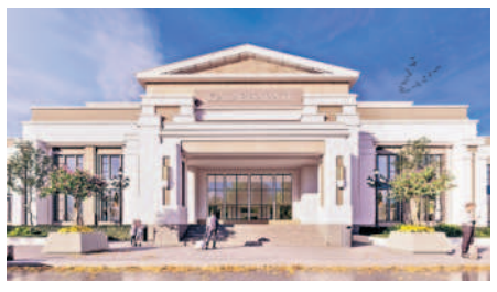
కళాభారతి నమూనా చిత్రం నల్లగొండ కళాభారతికి రూ.93కోట్లు నిధులు విడుదల చేస్తూ ఉత్తరువులు జారీ ఈ నెల 2న శంకుస్థాపన చేసిన మంత్రులు కేటీఆర్, జగదీశ్ రెడ్డి

'స్వరాష్ట్రంలో ముఖ్యమంత్రి కేసీఆర్ పాలన తెలంగాణకు స్వర్ణయుగాన్ని తెచ్చింది. 2014కు ముందు అవేతనంగా మారిన కుల సంఘాలు, వృత్తులకు జీవం పోసింది సీఎం కేసీఆర్. వృత్తిదారులను ఆర్థికంగా బలోపేతం చేసేందుకు ముఖ్యమంత్రి ఎంతో కృషి చేస్తున్నారు' అని రాష్ట్ర విద్యుత్ శాఖ మంత్రి గుంటకండ్ల జగదీశ్ రెడ్డి అన్నారు. సూర్యాపేట మండలంలోని కేసారం గ్రామ సమీపంలో బుట్టాజు, మేదరి, రజక సంఘాల కమ్యూనిటీ హాల్లు, మొబైల్ షాప్స్ అసోసియేషన్ భవన నిర్మాణాలకు, పెన్షనరీ మండలం దోసపహాడ్లో వంద డబుల్ బెడ్రూం ఇండ్ల నిర్మాణాలకు శనివారం శంకుస్థాపన చేశారు. ఈ సందర్భంగా మంత్రి మాట్లాడుతూ రాష్ట్రం ఏర్పడక ముందు కరువు కాటకాలతో అలమటించిన సూర్యాపేట నేడు దేశానికి అన్నం పెట్టే అన్నపూర్ణగా అవతరించినది న్నారు. అందరి బాగు కోరే బీఆర్ఎస్ ను మరోమారు ఆశీర్వదించి కేసీఆర్ ను మూడోసారి ముఖ్యమంత్రిని చేయాలని ప్రజలను కోరారు. - సూర్యాపేట రూరల్, అక్టోబర్ 7