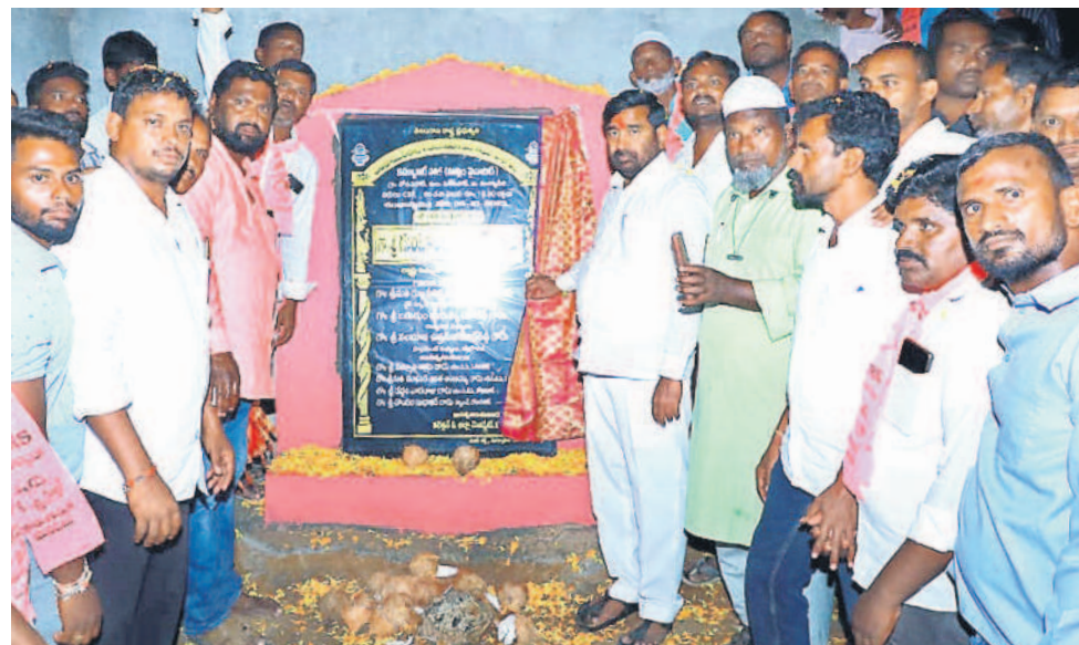
పెన్షనరీ మండలం దోసపహాడ్లో డబుల్ బెడ్రూమ్ ఇండ్ల నిర్మాణానికి శంకుస్థాపన చేస్తున్న మంత్రి గుంటకండ్ల జగదీశ్ రెడ్డి