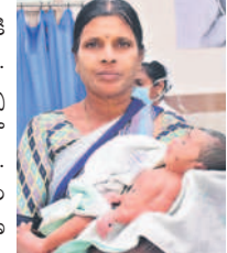
కేంద్రానికి తీసుకోవాలి. మూడు రోజుల నుంచి చికిత్స అందిస్తున్నారు.