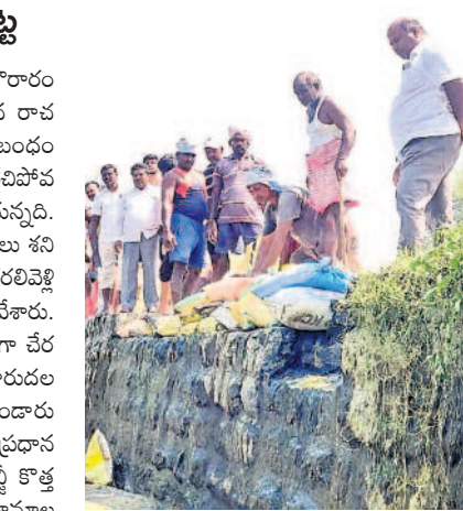
నీరు పోకుండా ఇసుక బస్తాలు అడ్డు వేస్తున్న ఆయకట్టు రైతులు

కట్టంగూర్, అక్టోబర్ 7 : మండల కేంద్రంలోని శ్రీ కృష్ణ గోశాలలో శనివారం గరుకు స్తంభాల ప్రతిష్ఠాపన కార్యక్రమం ఘనంగా నిర్వహించారు. గోమాతల కోసం పితృ దేవతల పేరు మీద భక్తులు గోశాలకు