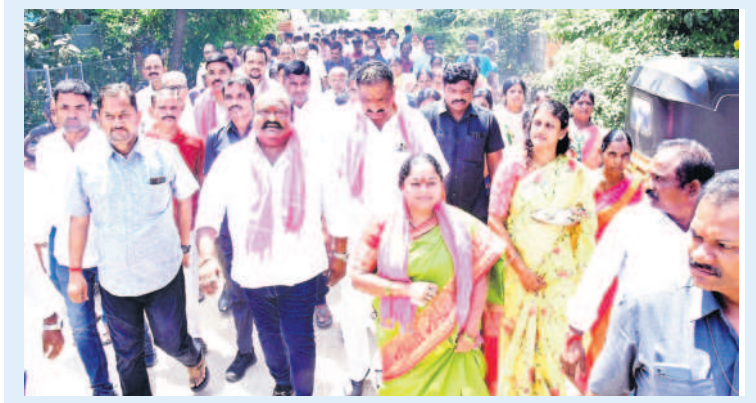
కరీంనగర్: నగరంలో వర్షబీస్టున్న మంత్రి గంగుల కమలాకర్

మంత్రి కొప్పుల ఈశ్వర్ ధర్మపురి నియోజకవర్గంలో అభివృద్ధి పనులకు శంకుస్థాపనలు, ప్రారంభోత్సవాలను చేస్తూ విస్తృతంగా పర్యటిస్తున్నారు. ఇప్పటికే గ్రామగ్రామాలను తిరిగిన ఆయన, రెండో దశా ప్రచారం మొదలు పెట్టారు. ఇప్పటికే దాదాపు 13 ఎత్తిపోతల పథకాలను వినియోగంలోకి తెచ్చారు. వందశాతానికి పైగా సాగు విస్తీర్ణం పెంచడంలో విజయం సాధించిన ఆయన, తాజాగా నియోజకవర్గానికి వ్యవసాయ కళాశాల సాధించారు. తాజాగా మంత్రి కేటీఆర్ నిర్వహించిన సభ పూర్తి స్థాయిలో విజయ వంతమైంది. ఈ సందర్భంగా కొప్పుల గురించి మంత్రి కేటీఆర్ వివరించిన తీరు ఆందరినీ ఆకట్టుకోగా, మంచి విజయాన్ని అందించేందుకు సబ్బుండవర్రాల ఆశీస్సులు అందిస్తున్నారు.