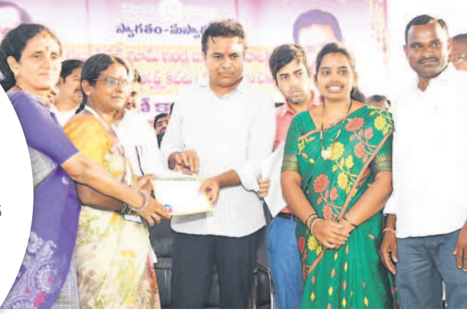
ఈనెల 3న సిరిసిల్లలో మహిళా కు ఇంటి పట్టాను అందజేస్తున్న మంత్రి కేటీఆర్

సిరిసిల్ల నియోజకవర్గంలో ప్రస్తుత అభ్యర్థి, మంత్రి కేటీఆర్ తిరుగులేని శక్తిని ఎదిగారు. గత ఎన్నికల సమయంలో 89,009 ఓట్ల మెజారిటీతో రికార్డు సృష్టించారు. ఈ పరిస్థితుల్లో ఇక్కడ ఇతర పార్టీల నుంచి ఎవరూ పోటీచేసినా డిమాండ్ దక్కలే చాలన్నట్లుగా ప్రచారం జరుగుతున్నది. అయినా మంత్రి కేటీఆర్, తనపైన శైలిలో ప్రచారం చేస్తూనే ఉన్నారు. నిజానికి అందరికంటే ముందుగానే కేటీఆర్ తండ్రిగారితో సభలో తన ఎన్నికల ప్రచారాన్ని మొదలు పెట్టారు. ఇప్పటికే చేసిన అభివృద్ధి పనులతోపాటు ఇంకా నియోజకవర్గానికి అవసరమైన అనేక అభివృద్ధి పనులకు ప్రారంభోత్సవాలు చేస్తూ, ప్రజల మన్ననలు పొందుతున్నారు. అభివృద్ధి, సంక్షేమాన్ని కండ్లారా చూస్తున్న ప్రజలు మరోసారి కేటీఆర్ రాజాలని కోరుకుంటున్నారు. రాబోయే ఎన్నికల్లో సంపూర్ణ ఆశీర్వాదాలు అందించేందుకు సిద్ధమయ్యారు.