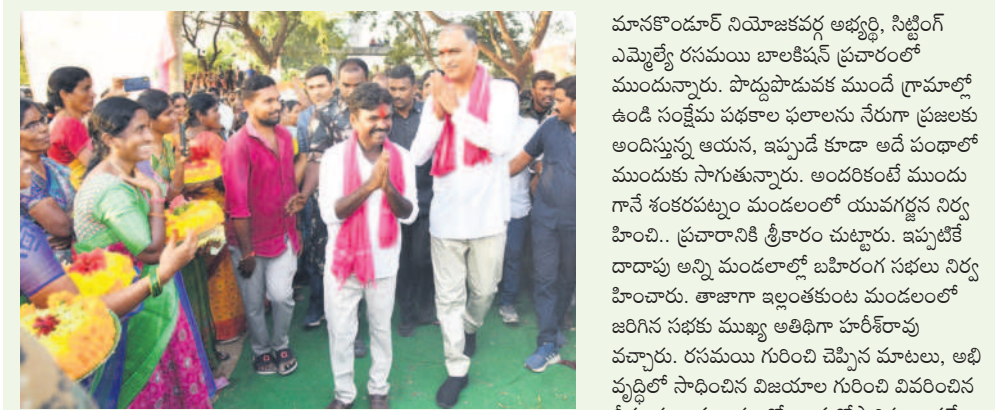
ఈనెల 6న ఇల్లంటకుంటలో బహిరంగ సభకు వస్తూ మహిళా లకు నమస్కరిస్తున్న మంత్రి హరిశ్చంద్రా, ఎమ్మెల్యే రసమయి