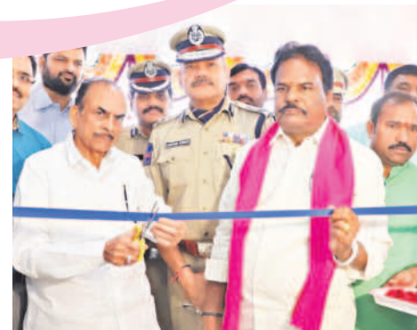
కడూల్ పోలీస్ స్టేషన్ ను ప్రారంభిస్తున్న హోంమంత్రి మహమూద్ అలీ, ఎమ్మెల్యే జైపాల్ యాదవ్