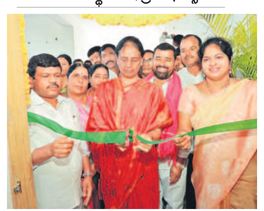
బడంగిపేట మున్సిపల్ కార్పొరేషన్ నూతన భవనాన్ని ప్రారంభిస్తున్న విద్యాశాఖ మంత్రి సబితాదేవి