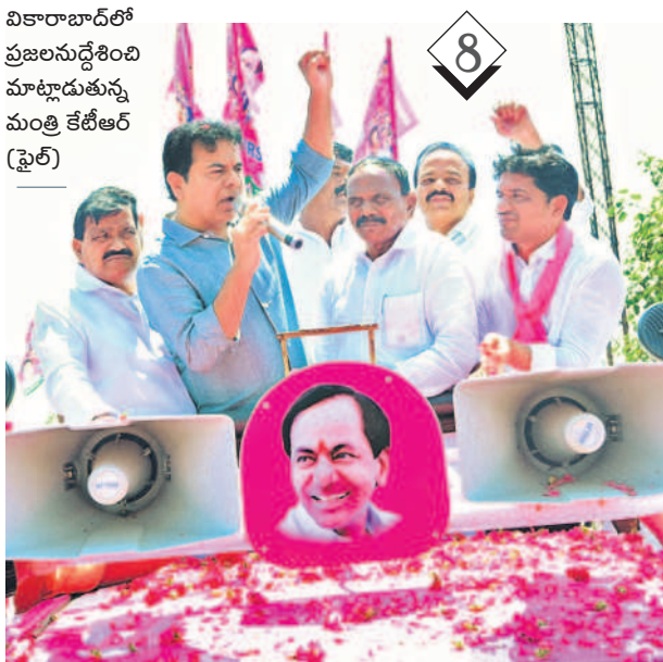
వికారాబాద్ లో ప్రజలనుద్దేశించి మాట్లాడుతున్న మంత్రి కేటీఆర్ (ఫైల్)

శంకుస్థాపనలు, ప్రారంభోత్సవాలతో మంత్రులు, ఎమ్మెల్యేలు బిజీ బిజీ