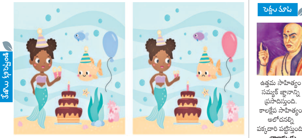
బతేలా కనిపిస్తున్న ఈ రెండు చిత్రాల్లో 10 తేదాయిన్నాయి. అవేంటో కనిపెట్టండి.