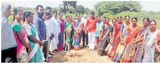
డ్యూక్రా భవనం పనులను ప్రారంభిస్తున్న ఎంపీపీ, జడ్పీటీసీ