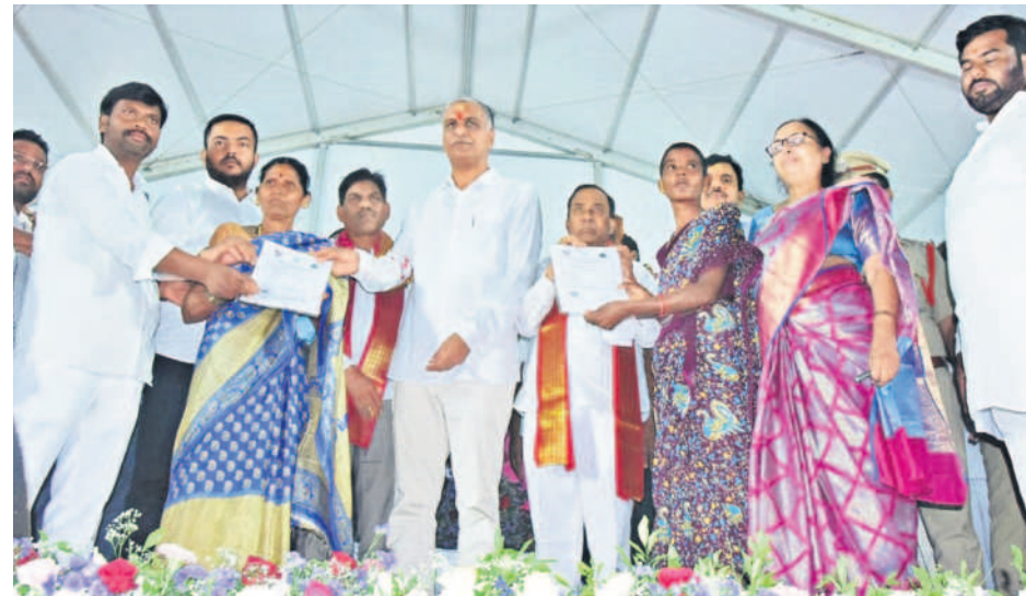
జహీరాబాద్లో అభిదారులకు గృహలక్ష్మి ప్రాసీడింగ్స్ అందజేస్తున్న మంత్రి హరీశ్ రావు