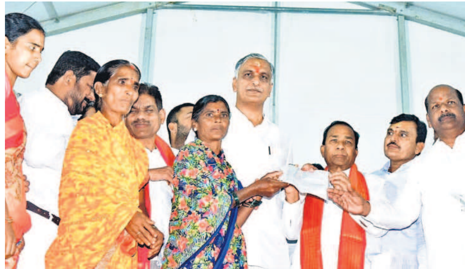
జహీరాబాద్లో మహిళా సంఘాలకు చెక్కులు అందజేస్తున్న మంత్రి హరీశ్ రావు