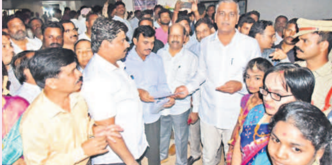
కవేలి హోటల్ మేనేజ్మెంట్ డిగ్రీ కళాశాలలో మాట్లాడుతున్న మంత్రి హరీశ్ రావు