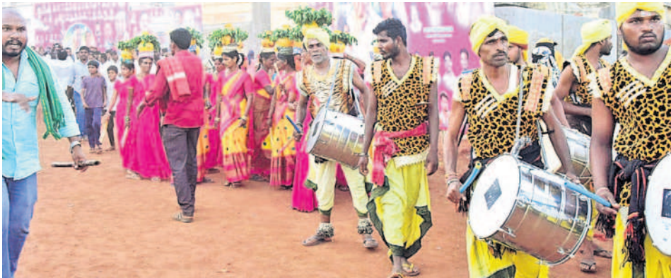
జహీరాబాద్లో మంత్రి హరీశ్ రావుకు స్వాగతం పలుకుతున్న కళాకారులు, మహిళలు