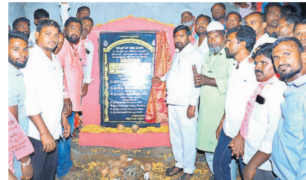
పెన్షనరీ మండలం దోసపహాడ్లో డబుల్ బెడ్రూమ్ ఇండ్ల నిర్మాణానికి శంకుస్థాపన చేస్తున్న మంత్రి గుంటకండ్ల జగదీశ్వర్రెడ్డి